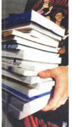
Καταργείται η Τράπεζα Θεμάτων για τους μαθητές της δευτεροβάθμιας εκπαίδευσης