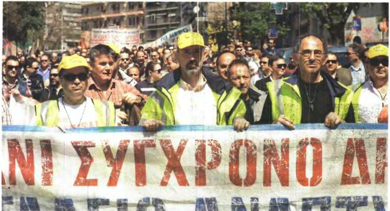
▲ ΤΟ ΖΗΤΗΜΑ ΤΩΝ ΑΛΛΑΓΩΝ που προωθεί η κυβέρνηση στα εργασιακά έχει βρεθεί στο τραπέζι των διαπραγματεύσεων με τους δανειστής

«ΚΑΜΠΑΝΑΚΙ» ΑΠΟ ΤΗ ΓΣΕΕ ΓΙΑ ΤΗ ΛΗΞΗ ΤΗΣ ΜΕΤΕΝΕΡΓΕΙΑΣ ΣΤΙΣ ΣΥΜΒΑΣΕΙΣ