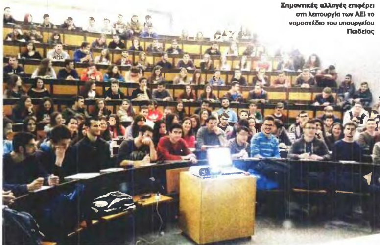
Σημαντικές αλλαγές επιφέρει στη λειτουργία των ΑΕΙ το νομοσχέδιο του υπουργείου Παιδείας

Απαντήσεις για τη διοίκηση των ΑΕΙ, τους «αιώνιους» μετεγγραφές, το πανεπιστημιακό ύσλο