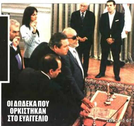
ΟΙ ΔΩΔΕΚΑ ΠΟΥ ΟΡΚΙΣΤΗΚΑΝ ΣΤΟ ΕΥΑΓΓΕΛΙΟ

Στην πριονοκορδέλα τα (ήδη μειωμένα) εισοδήματα! Αφορολόγητο μόνο για όσους κερδίζουν έως 12.000 ετησίως. Ασφυξία χωρίς έλεος για τους ελεύθ. επαγγελματίες