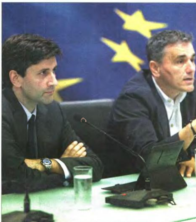
Γιώργος Χουλιαράκης και Ευαγγέλιος Τσακαλώτος