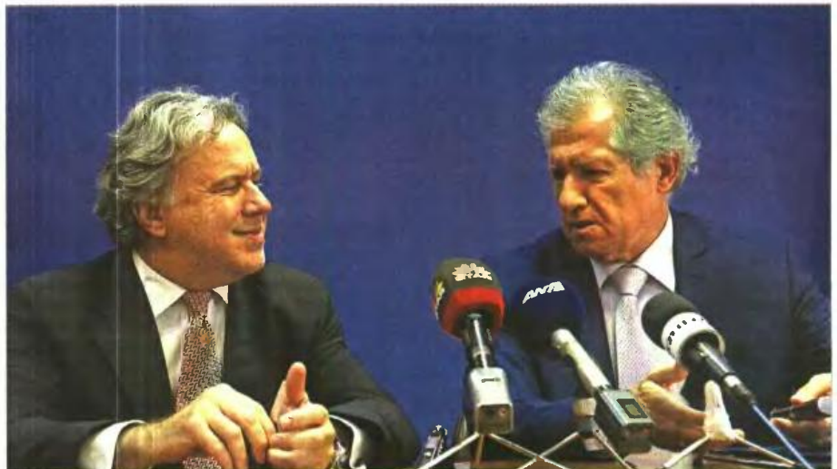
» Ο Γ. Κατρούγκαλος στην τελετή παράδοσης-παραλαβής με τον υπηρεσιακό υπουργό Δ. Μουστάκα