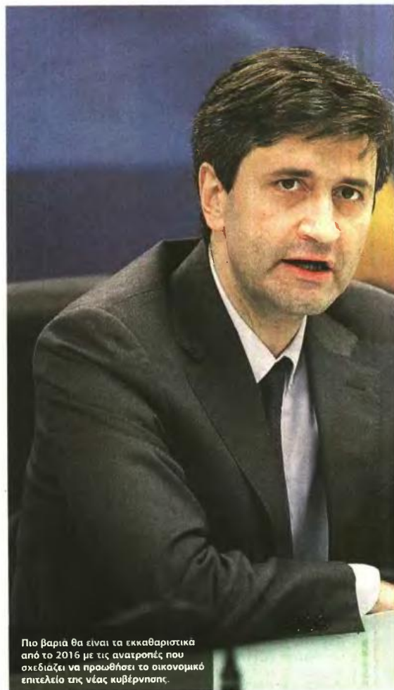
Πιο βαριά θα είναι τα εκκαθαριστικά από το 2016 με τις ανατροπές που σχεδιάζει να προωθήσει το οικονομικό επιτελείο της νέας κυβέρνησης.