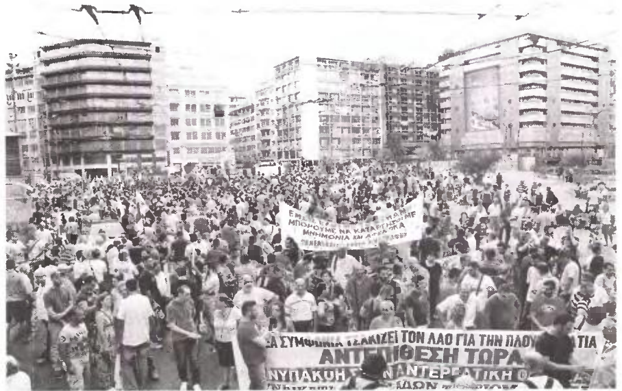
Από τη συγκέντρωση του ΠΑΜΕ στην Αθήνα, ενάντια στο 3ο μνημόνιο, την περασμένη Πέμπτη

σμένος οποιουδήποτε Ταμείου δε θα μπορεί να συνταξιοδοτείται πριν από το 67ο έτος της ηλικίας του. Μάλιστα, και αυτό ακόμα το ηλικιακό όριο των 67 ετών τίθεται υπό επανεξέταση (αύξηση), σε εξάρτηση με το προσδόκιμο ζωής, όπως προβλέπει και σχετική διάταξη του νόμου 3863.