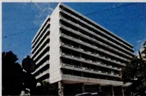
Πυρετός στο υπουργείο Οικονομικών για την εφαρμογή του πρώτου πακέτου μέτρων και την προετοιμασία του δεύτερου από τον Σεπτέμβριο.

— Ενσωμάτωση της εισπραχθείσ εισφορών κοινωνικής ασφάλισης στη φορολογική διοίκηση (Δεκέμβριος 2017).