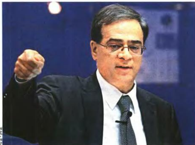
Το οικονομικό επιτελείο φαίνεται πως θα αναγκαστεί να... «ζαναγράψει» τον προϋπολογισμό του 2015

Σύμφωνα με καλά ενημερωμένες πηγές, στην πολώρω-