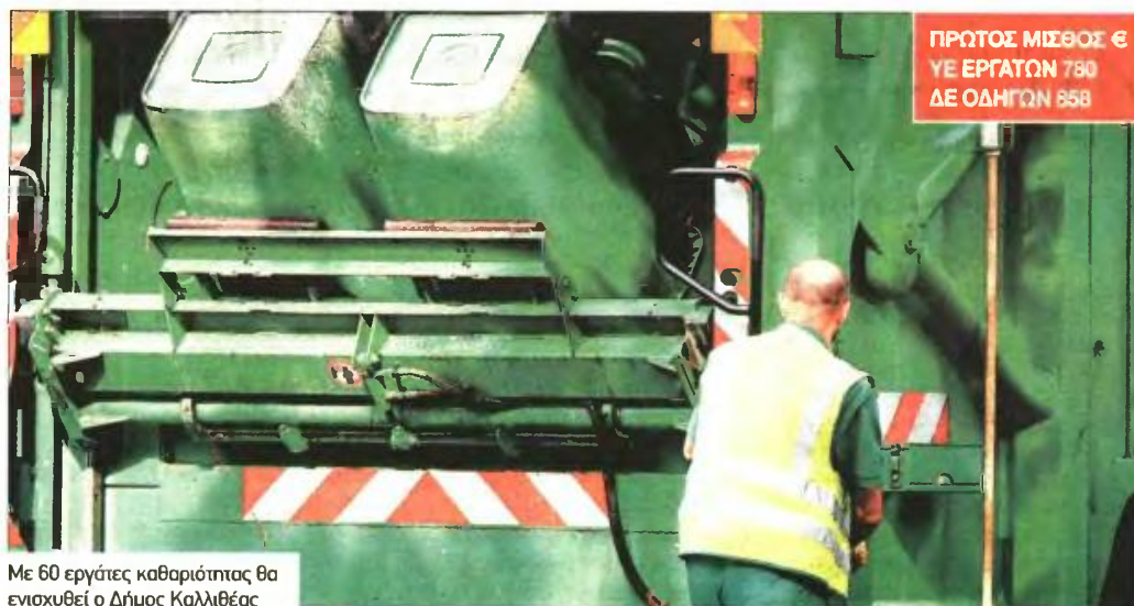
Με 60 εργάτες καθαριότητας θα ενισχυθεί ο Δήμος Καλλιθέας

Ζητούνται άμεσα οδηγοί απορριματοφόρων, εργάτες καθαριότητας, ηλεκτρολόγοι - Με κοινωνικά κριτήρια η πρόσληψη των επιτυχόντων