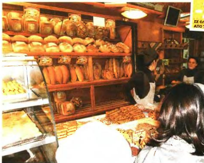
Φθηνότερο ψωμί θα προμηθεύονται από τις 15 Οκτωβρίου άνεργοι και πολύτεκνοι.

«Η δράση 'Γείτονες' αποτελεί μια κίνηση αλληλεγγύης των Σωματείων Αρτοποιιών Κεντρικής Μακεδονίας και της περιφέρειας. Βασική αρχή μας αποτελεί να βρισκόμαστε διαρκώς δίπλα στους ευάλωτους συμπολίτες μας» τόνισε ο περιφερειάρχης Απόστολος Τζιτζικώστας, ο οποίος στήριξε τη σύμπραξη δημόσιας διοίκησης και ιδιωτικών φορέων, προκειμένου, όπως είπε, να στηριχθούν εκείνοι που δοκιμά-