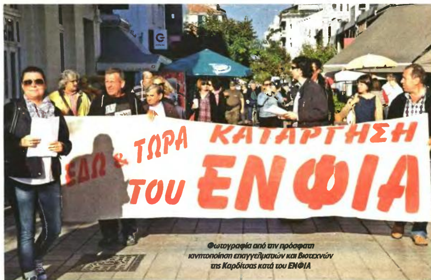
Φωτογραφία από την πρόσφατη κινητοποίηση επαγγελματιών και βιοτεχνών της Καρδίτσας κατά του ΕΝΦΙΑ

Έτσι από την 1η Ιανουαρίου του 2015 η «δαγκάνα» του «πόθεν έσχες» θα εφαρμόζεται μόνο επί της πραγματικής αξίας του ακινήτου, στην οποία γίνεται το συμβόλαιο και όχι στην εξωπραγματικά