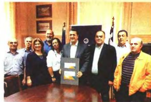
Η έναρξη της δράσης «Γείτονες» παρουσιάστηκε στην περιφέρεια Κεντρικής Μακεδονίας από τον Απόστολο Τζιτζικώστα.

Η δράση «Γείτονες» εντάσσεται σε ένα ευρύ πρόγραμμα κοινωνικής αλληλεγγύης που υλοποιεί τα τελευταία δύο χρόνια η περιφέρεια Κεντρικής Μακεδονίας, η οποία θα αναλάβει εκ νέου πρωτοβουλία για τη συγκέντρωση ρούκων και παιχνιδιών σε παιδιά άπορων οικογενειών, δωροεπιταγές, συγκέντρωση φαρμάκων για τα κοινωνικά ιατρεία κ.ά. Στόχος μάλιστα της περιφέρειας Κεντρικής Μακεδονίας είναι να διασφαλίσει μέσα από το νέα ΕΣΠΑ (ΣΕΣ 2014-2020) κοנדύλια για τη δημιουργία δομών πρόνοιας σε ολόκληρη την Κεντρική Μακεδονία, αφού προηγουμένως καταγράψει τις ανάγκες που υπάρχουν. Ερωτηθείς σχετικά, ο περιφερειάρχης Απόστολος Τζιτζικώστας τόνισε ότι μέχρι στιγμής δεν είναι γνωστό πόσα κοנדύλια θα κατανεμηθούν στην Κεντρική Μακεδονία, καθώς, όπως είπε, δεν έχει ανακοινωθεί ακόμα η δομή και το περιεχόμενο του νέου προγράμματος, το οποίο, παρότι εντάσσεται και το 2014, δεν έχει αρχίσει ακόμα.