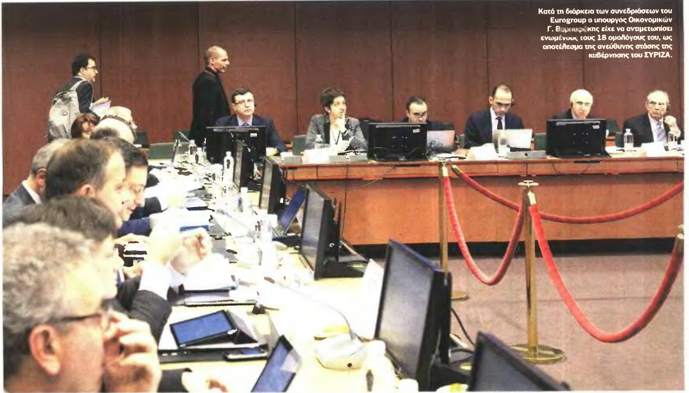
Κατά τη διάρκεια των συνεδριάσεων του Eurogroup ο υπουργός Οικονομικών Γ. Βασιλείου είχε να αντιμετωπίσει εναντίον τους 18 ομολογίες του, ως αποτέλεσμα της ανεύθυνης στάσης της κυβέρνησης του ΣΥΡΙΖΑ.