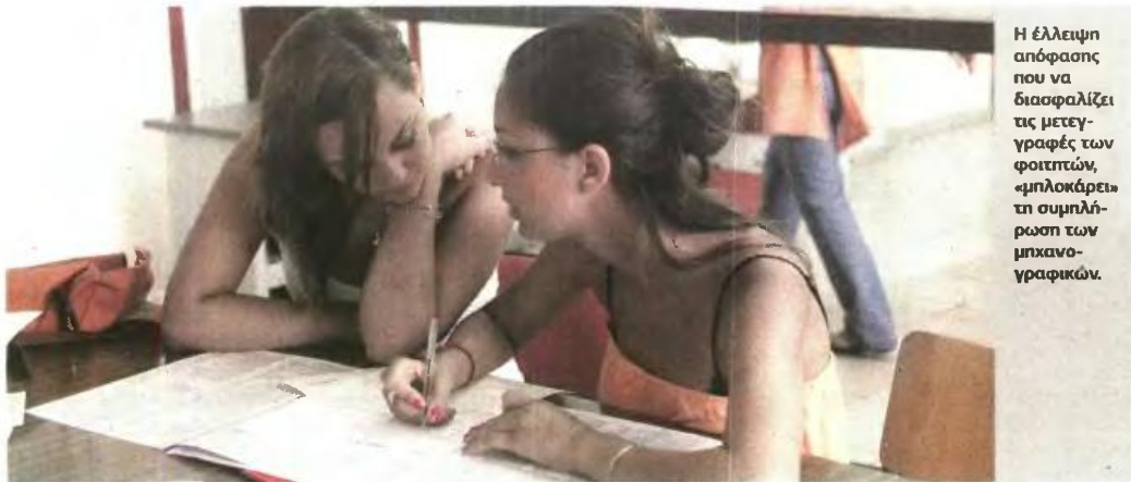
Η έλλειψη απόφασης που να διασφαλίζει τις μετεγγραφές των φοιτητών, «μπλοκάρει» τη συμπλήρωση των μηχανογραφικών.

ΚΑΜΙΑ ΥΠΟΥΡΓΙΚΗ ΑΠΟΦΑΣΗ ΓΙΑ ΤΑ ΠΑΙΔΙΑ ΤΡΙΤΕΚΝΩΝ - ΠΟΛΥΤΕΚΝΩΝ