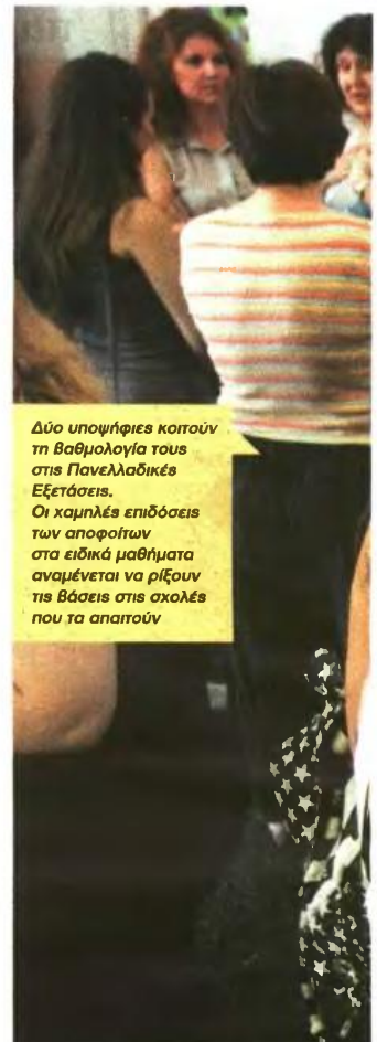
Δύο υποψήφιοι κοιτούν τη βαθμολογία τους στις Πανελλαδικές Εξετάσεις. Οι χαμηλές επιδόσεις των αποφοίτων στα ειδικά μαθήματα αναμένεται να ρίξουν τις βάσεις στις σχολές που τα απαιτούν

Μέσω επέκτασης της ψηφιακής διδασκαλίας μελετά να περιορίσει την ανάγκη για μετεγγραφές του χρόνου ο υπουργός Παιδείας Ανδρέας Λοβέρδος! Σύμφωνα με πληροφορίες των «ΝΕΩΝ», ο κ. Λοβέρδος έχει δεχθεί ήδη εισηγήσεις από εκπαιδευτικά ιδρύματα, ιδίως της περιφέρειας, που διατείνονται ότι είναι εφικτό να επεκταθεί η ψηφιακή διδασκαλία σε φοιτητές οι οποίοι θα παρακολουθούν μαθήματα από το σπίτι τους και θα πηγαίνουν στα πανεπιστήμια σε προεπιλεγμένα διαστήματα για τα εργαστήρια, τις εξετάσεις και τις επαφές με τους καθηγητές τους! Μάλιστα η σκέψη αυτή μπορεί να έχει εφαρμογή και στη Δευτεροβάθμια Εκπαίδευση, έτσι ώστε σε πολλά χωριά που λείπουν για ένα διάστημα εκπαιδευτικοί να μην κάνονται μαθήματα Γραμμικού Σχεδίου, Αγγλικά, Γαλλικά, Γερμανικά, Ιταλικά, Ισπανικά, Αρμονία, Έλεγχος Μουσικών Ακουστικών Ικανοτήτων