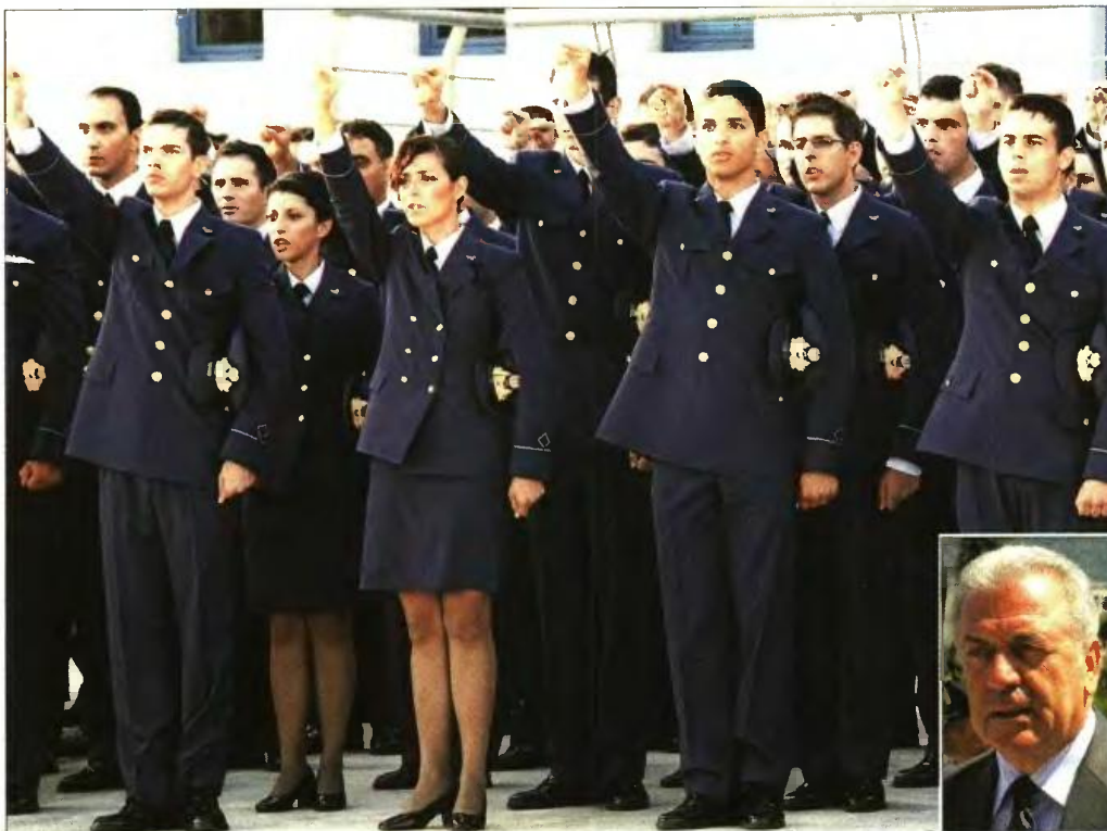
Από ορκωμοσία νέων ανθυπομηχανικών της Σχολής Ικάρων. Ενθετη: Ο υπουργός Αμυνας Δημήτρης Αβραμόπουλος

Ρεπορτάζ Λάμπρος Ζαχαριάς lzacharis2dimokratianews.gr