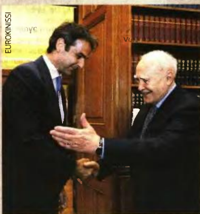
Ο Κάρλος Παπούλιας υποδέχθηκε τον Κ. Μητσοτάκη στο Προεδρικό Μέγαρο.

ΤΑ ΜΕΙΖΟΝΑ ζητήματα των αλλαγών στη δημόσια διοίκηση, αλλά και των μνημονιακών δεσμεύσεων της χώρας μας έναντι του Μνημονιακού Στήριξης θα τεθούν επί τάπητος στη σημερινή συνεδρίαση του κυβερνητικού συμβουλίου μεταρρύθμισης. Υπό την προεδρία του πρωθυπουργού, Αντώνη Σαμαρά, οι συναρμόδιοι υπουργοί θα συζητήσουν την προώθηση του δεύτερου κύματος της διαθεσιμότητας-κινητικότητας, που έχει χρονικό ορίζοντα το τέλος Σεπτεμβρίου.