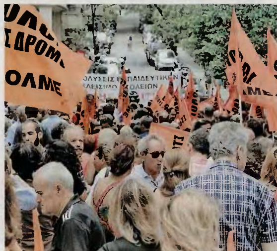
Συλλαλητήριο έξω από το υπουργείο Οικονομικών πραγματοποιήσε χθες η ΟΛΜΕ, ενώ κινητοποιήσεις οργανώθηκαν σε διάφορες πόλεις.

καν οι εκπαιδευτικοί που εμπιπτουν στις κατηγορίες των εξαιρέσεων να καταθέσουν τα σχετικά δικαιολογητικά τους, έως και πέντε κατά περίπτωση, μέσα σε λίγες ώρες. Συγκεκριμένα, με βάση την εγκύκλιο οι Διευθύνσεις Εκπαίδευσης υποχρεούνται να τα αποστείλουν στο υπουργείο έως τις 2 μ.μ. του περασμένου Σαββάτου. Δηλαδή, η διαδικασία έπρεπε να ολοκληρωθεί εντός ελαχίστων ωρών μη εργάσιμης ημέρας. «Καταγγέλλουμε το υπουργείο Παιδείας για τη χωρίς ιερό και όσιο δράση του, προκειμένου να υλοποιήσει χωρίς καθυστέρηση την τροϊκανή εντολή, να ρίξει στον Καιάδα της διαθεσιμότητας - απόλυσης χιλιάδες εκπαιδευτικούς της ΤΕΕ. Εργάζονται ακόμα και τις βραδινές ώρες και τις αργίες γι' αυτό