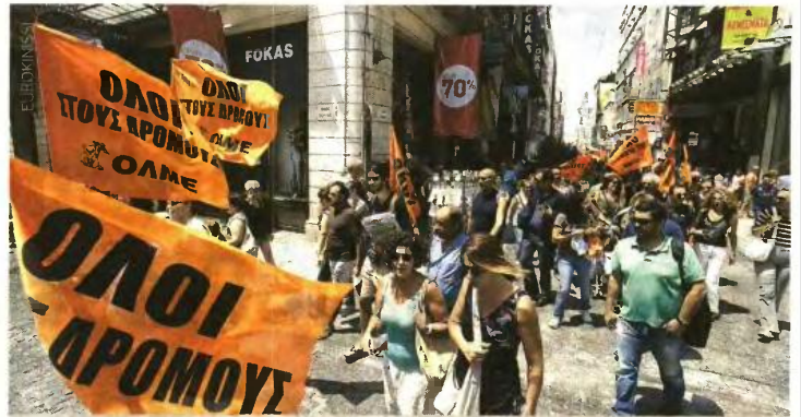
Η ΟΛΜΕ πραγματοποιήσε συγκέντρωση και πορεία διαμαρτυρίας χθες στο υπουργείο Οικονομικών ενώ κινητοποιήσεις οργανώθηκαν και σε πόλεις.

Η πρεμιέρα της διαθεσιμότητας στο χώρο της εκπαίδευσης πυροδότησε την αντίδραση της ΟΛΜΕ που πραγματοποιήσε συγκέντρωση και πορεία στο υπουργείο Οικονομικών ενώ οργανώθηκαν κινητοποιήσεις καταμεσής του καλοκαιριού και σε διάφορες πόλεις. Ομάδα εκπαιδευτικών κατέλαβε χθες τα γραφεία της διεύθυνσης δευτεροβάθμιας