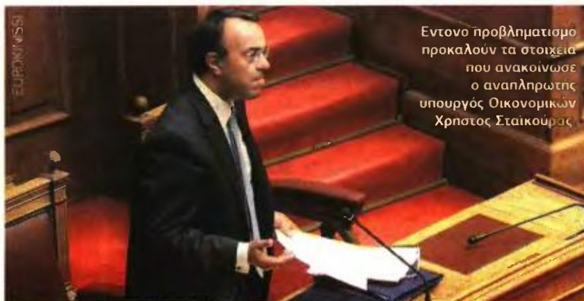
Έντονο προβληματισμό προκαλούν τα στοιχεία που ανακοίνωσε ο αναπληρωτής υπουργός Οικονομικών Χρήστος Σταϊκούρας

δαπανών (μεταξύ αυτών τα πολυτεχνικά επιδόματα, συνολικού ύψους 320 εκατ. ευρώ) και οι δαπάνες του Προγράμματος Δημοσίων Επενδύσεων είναι μειωμένες κατά 1,078 δισ. ευρώ σε σχέση με το στόχο. Στο μέτωπο των ασφαλιστικών ταμείων, το μεγαλύτερο ποσοστό απορρόφησης της ετήσιας επιχορήγησης καταγράφεται το 1ο εξάμηνο του έτους στον ΟΑΕΕ (59,9%) και στο ΤΑΠ ΟΤΕ (67,3%).