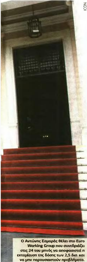
Ο Αντώνης Σαμαράς θέλει στο Euro Working Group που συνεδριάζει στις 24 του μηνός να αποφασιστεί η εκταμίευση της δόσης των 2,5 δισ. και να μην παρουσιαστούν προβλήματα.