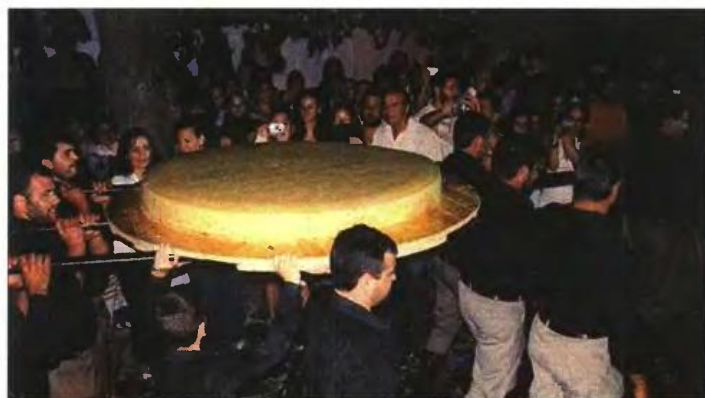
▲ Το κεφαλοτύρι-γίγας θα παρουσιαστεί, θα κοπεί και θα μοιραστεί στις 28 Ιουλίου στην 6η ετήσια Γιορτή Βοσκού και Τυριού που διοργανώνει ο Πολιτιστικός Σύλλογος Ζωνιανών.