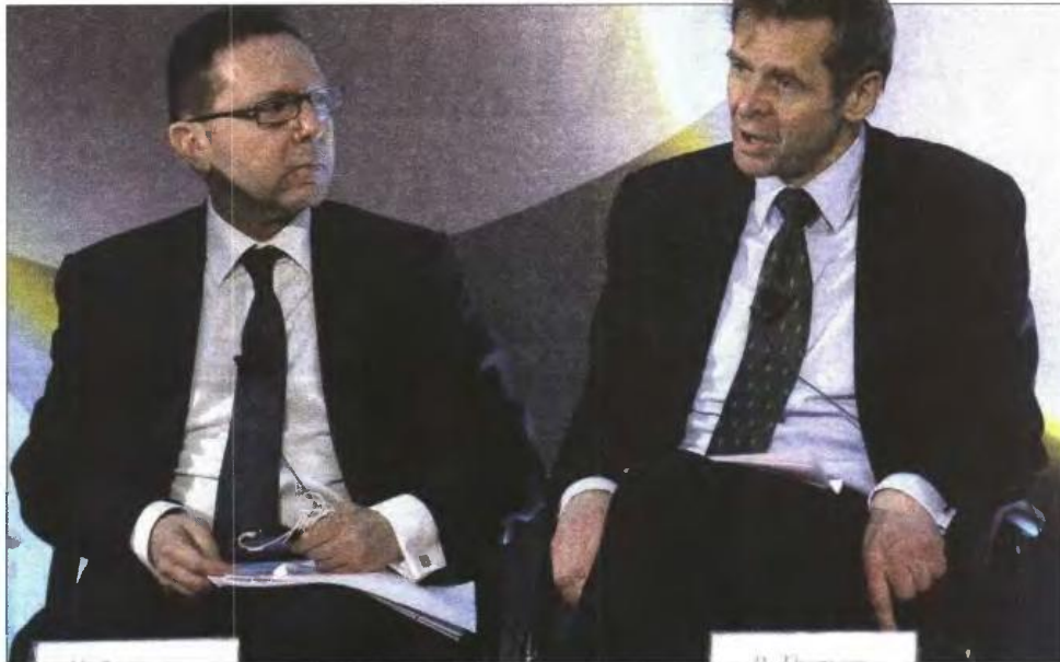
Ο υπουργός Οικονομικών Γιάννης Στουρνάρας με τον εκπρόσωπο του ΔΝΤ στην τρένικα Πολ Τόμσεν (φωτό αρχείου)