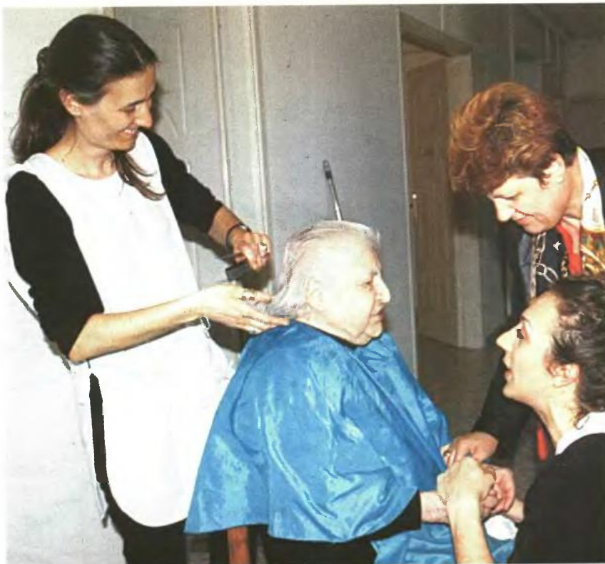
Οι σπουδάστριες κομμωτικές του ΟΑΕΔ προσφέρουν εθελοντική εργασία σε γηροκομεία

Την τελευταία φορά μισός τόνος του εμπορεύματός του έφτασε σε ανθρώπους που έχουν ανάγκη λίγες ώρες αφότου τα έφερε το γρι. «Πρέπει να κινούμαστε γρήγορα, το προϊόν είναι ευπαθές και δεν κρα-