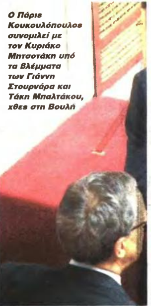
Ο Πάρις Κουκουλούδουλες συνομιλεί με τον Κυριάκο Μητσοτάκη υπό τα βλέμματα των Γιάννη Στουρνάρα και Τάκη Μπαλτάκου, χθες στη Βουλή

Η ΠΟΛΥΗΜΕΡΗ συζήτηση για το πολυνομοσχέδιο ανέδειξε την κακή ψυχολογία των βουλευτών κυρίως της Νέας Δημοκρατίας. Δεν είναι τυχαίο ότι 33 βουλευτές της γαλάζιας παράταξης διεμήνυσαν χθες στο Μαξίμου με επιστολή τους ότι δεν προετίθεντο να ψηφίσουν τη διάταξη του πολυνομοσχεδίου που προέβλεπε την καταβολή αποζημιώσεων στους απολυμένους της ΕΡΤ πάνω από το πλαφόν των αποζημιώσεων που δίνονται για τις ΔΕΚΟ. Ακόμη και ο κοινοβουλευτικός εκπρόσωπος της ΝΔ Μάκης Βορίδης καταφέρθηκε εναντίον του επίμαχου άρθρου, το οποίο τελικώς αποσύρθηκε. Την ίδια ώρα αρκετοί βουλευτές της ΝΔ διαμαρτύρονται όχι μόνο για πτωχικές της κυβερνητικής πολιτικής αλλά και για τη συμπεριφορά ορισμένων γαλάζιων υπουργών που θεωρούν ότι είναι «ασ' υψήλου». «Δεν είναι κυβέρνηση αυτή» είπε ο Νικήτας Κακλαμάνης, ενώ για φορολογικά επαναστατικά μετάρρυθμιση που δεν ήρθε μίλησε ο Ανδρέας Ψυχιάρης.