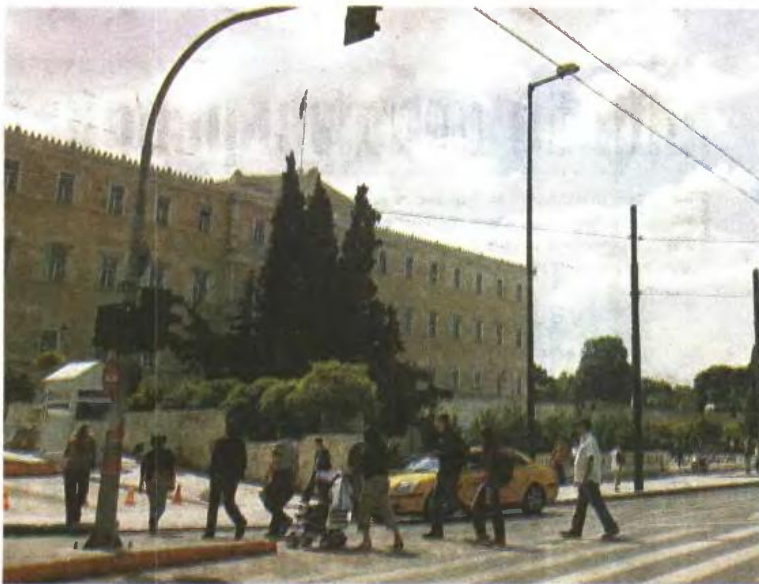
Η απαγόρευση ισχύει για όλη την Αθήνα και για ένα τμήμα της Αττικής από το αεροδρόμιο έως και το ευρύτερο κέντρο του Λεκανοπεδίου