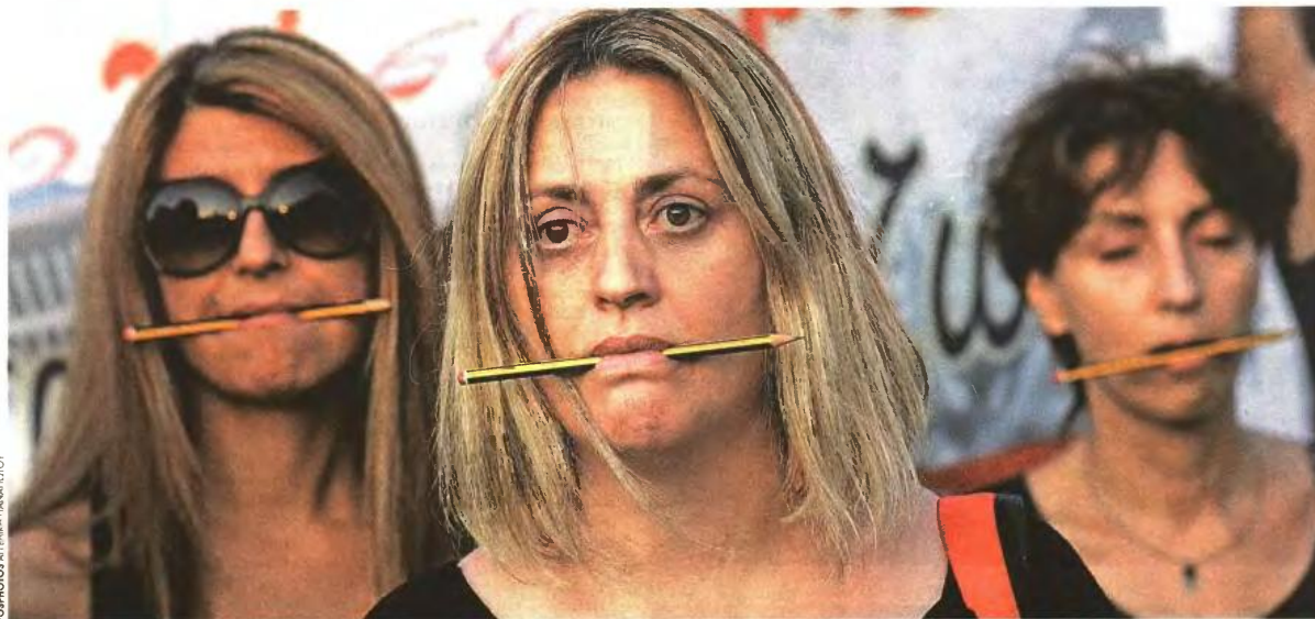
Με ένα μολύβι στο στόμα διαδήλωσαν οι καθηγητές και οι καθηγήτριες της Τεχνικής Εκπαίδευσης χθες από τη Βουλή

Εξαιρέσεις προβλέπει το πολυνομοσχέδιο για πολυτέκνους, τριτέκνους και όσους φροντίζουν άτομα με αναπηρία