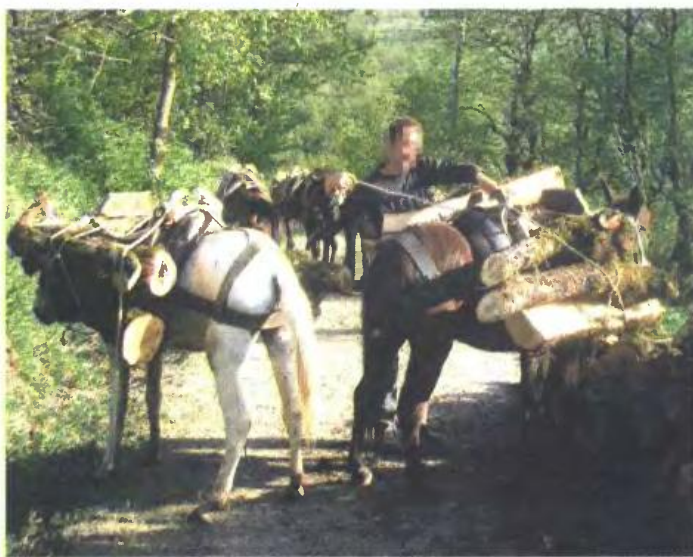
Πaráνομοι υλοτόμοι από την Αλβανία περνούν τα σύνορα στην Καστοριά, κόβουν δέντρα και μεταφέρουν τα ξύλα πίσω στη χώρα τους ακόμη και με μουλάρια.