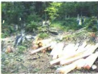
Μία από τις πρόσφατες φωτογραφίες με αποψιλωμένα δάση στην Καστοριά, που παρέδωσε κλιμάκιο της περιφέρειας Δυτικής Μακεδονίας στον υπουργό Άμυνας Δ. Αβραμόπουλο ζητώντας τη λειτουργία στρατιωτικών φυλακών στην περιοχή.

των πλοίσων αποθεμάτων τους. Βασικός λόγος είναι ότι συνορεύουν με την Αλβανία. Οι παράνομοι υλοτόμοι περνούν τα σύνορα, κόβουν δέντρα και μεταφέρουν τα ξύλα πίσω στην Αλβανία με μουλάρια ή ακόμη και με φορτηγά. Το τελευταίο κρούσμα αποκαλύφθηκε μόλις την προηγούμενη εβδομάδα από συνοριοφύλακες κοντά στο Ασημοχώρι Κόνιτσας. Οι αστυνομικοί συνέλαβαν έναν 31χρονο. Άλλοι δύο κατάφεραν να διαφύγουν. Κατασχέθηκαν τα ξύλα, τα εργαλεία και το αυτοκίνητο που χρησιμοποιούσαν οι λαθρουλοτόμοι.