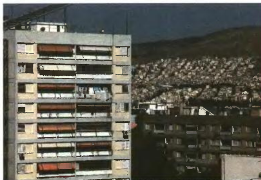
Το ενοίκιο για κύρια κατοικία καθώς και το ενοίκιο των παιδιών που σπουδάζουν περιλαμβάνονται στις δαπάνες