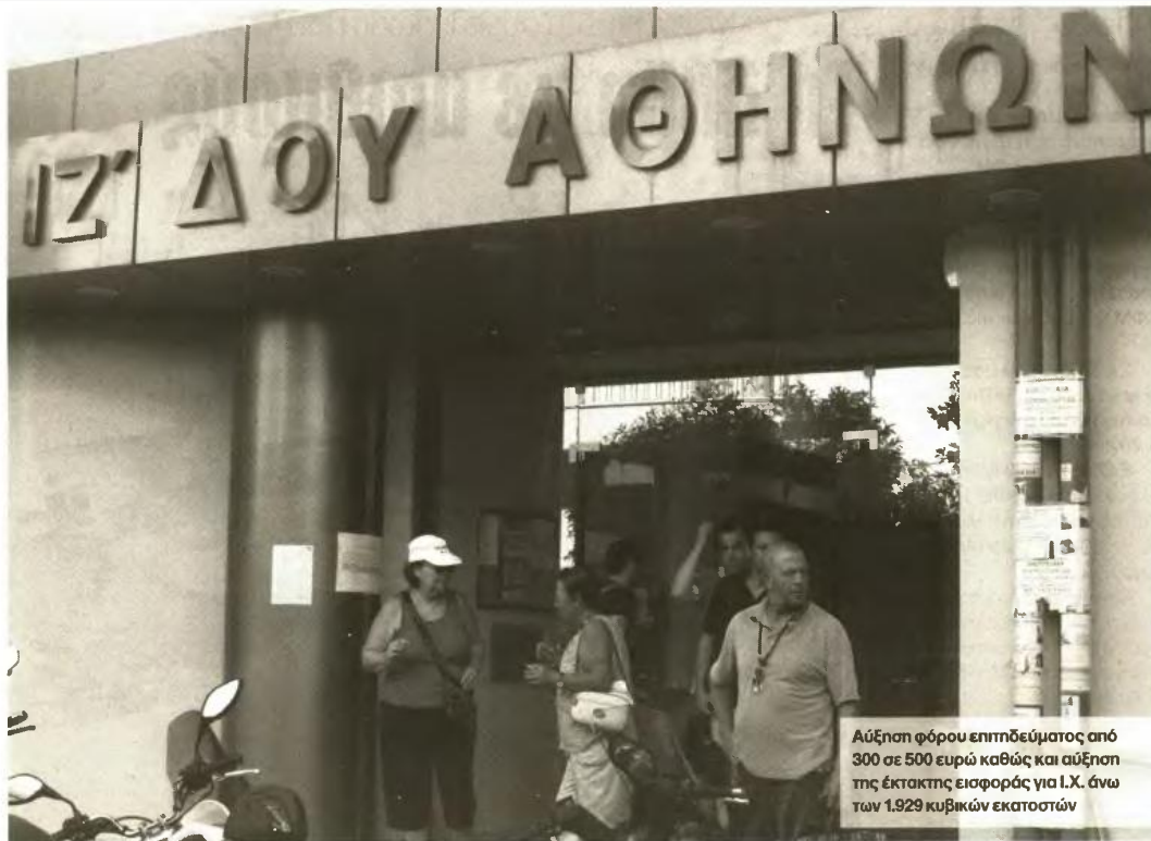
Αύξηση φόρου επιτηδεύματος από 300 σε 500 ευρώ καθώς και αύξηση της έκτακτης εισφοράς για Ι.Χ. άνω των 1.929 κυβικών εκατοστών

Αύξηση φόρου για χαμηλά και μεσαία εισοδήματα λόγω κλίμακας