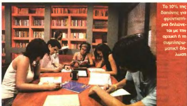
Το 10% της δαπάνης για φροντιστήρια δηλώνεται με την αρχική ή τη συμπληρωματική δήλωση