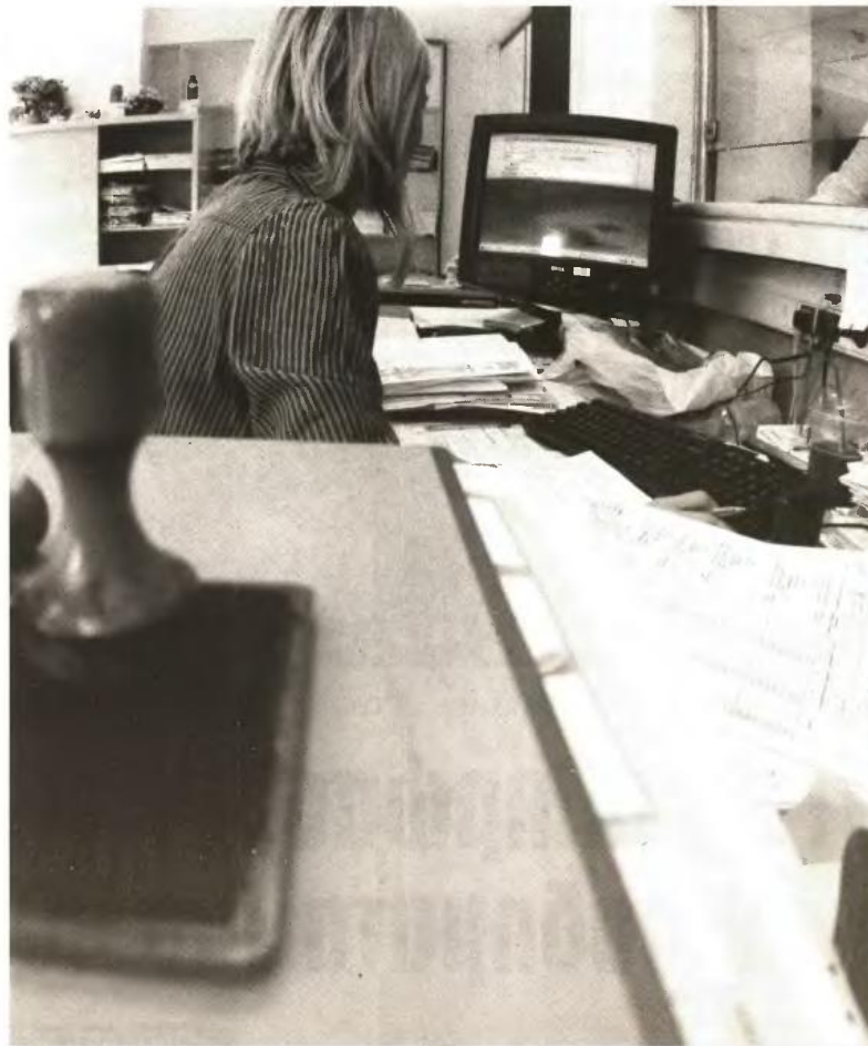
Έχει παρατηρηθεί σε 9.870 δηλώσεις, ενώ η δήλωση υποβάλλεται από υπόχρεη γυναίκα, να έχουν συμπληρωθεί κωδικό που αφορούν τη σύζυγο