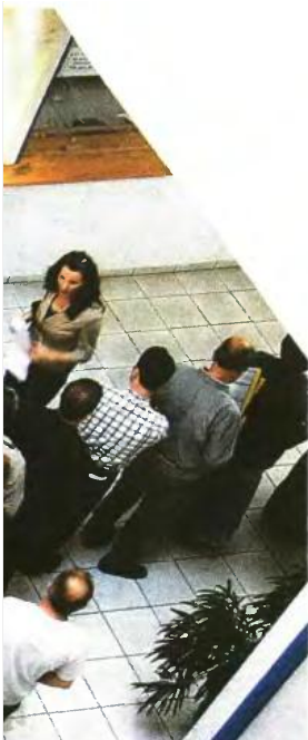
Ο φορολογούμενοι θα πρέπει να συνυποβάλουν με τη δήλωσή τους αποδείξεις ίσες με το 25% του εισοδήματός τους