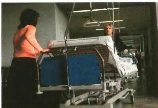
Από τα έξοδα ιατρικής και νοσοκομειακής περίθαλψης αφαιρείται ένα ποσό δαπάνης