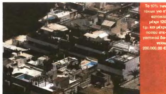
Το 10% των τόκων για α' κατοικία μέχρι 120 τ.μ. και μέχρι ποσού στεγαστικού δανείου 200.000,00 €