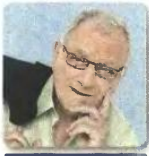
γράφει ο ΚΩΣΤΑΣ ΚΑΡΔΑΒΕΛΛΑΣ