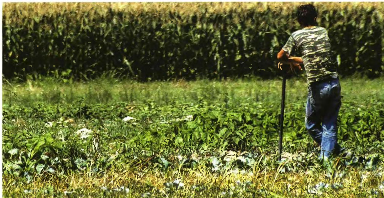
Με τον Ενιαίο Φόρο Ακινήτων θα φορολογηθούν οι ιδιοκτήτες αγροτεμαχίων και άλλων εκτάσεων, οι οποίες σήμερα δεν υπάγονται στο «καράτσι».

➔ Όσοι διαθέτουν κατοικία σε περιοχή με χαμηλή τιμή ζώνης θα λάβουν το 2014, όταν και θα τεθεί σε ισχύ ο Ενιαίος Φόρος, χαμηλότερο λογαριασμό σε σχέση με φέτος