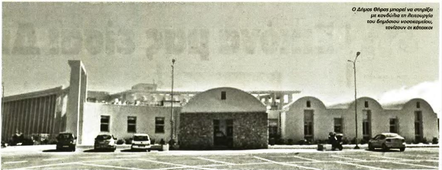
Ο Δήμος Θήρας μπορεί να στηρίξει με κονδύλια τη λειτουργία του δημόσιου νοσοκομείου, τόνιζαν οι κάτοικοι

ΣΑΝΤΟΡΙΝΗ: ΑΜΕΣΗ ΛΕΙΤΟΥΡΓΙΑ ΜΕ ΔΗΜΟΣΙΟ ΧΑΡΑΚΤΗΡΑ ΖΗΤΟΥΝ ΟΙ ΚΑΤΟΙΚΟΙ