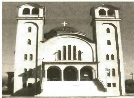
Το ξωκλήσι της Αγίας Βαρβάρας, στα νότια του Αγρινίου, αναβαθμίστηκε σε ενοριακό ναό, κάρη στις άοκνες προσπάθειες του παπα-Χριστόφορου, τον οποίο κάποιος -σήμερα- έσκυψε βάλει στο στόχαστρο.

Ο σημερινός μητροπολίτης ανέλαβε τα νήια της Μητρόπολης απ' το φθινόπωρο του 2005. Οπότε και το καθεστώς της ρουφιανοκρατίας λούφαξε προσωρινά, για να επανέλθει δριμύτερο. Με το πρόσχημα ότι τα οικονομικά της ενορίας της Αγίας Βαρβάρας πηγαίνουν απ' το κακό στο χειρότερο. Γεγονός, για το οποίο