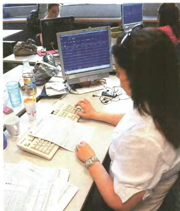
▲ ΕΝΟΙΚΙΑ, δίδακτρα σε φροντιστήρια, ιδιαίτερα μαθήματα, τόκοι στεγαστικών δανείων για την απόκτηση πρώτης κατοικίας, ιατρικά έξοδα, ασφαλιστήρια ζωής, έξοδα για ενεργειακή αναβάθμιση ακινήτων κ.λπ. μειώνουν τον φόρο

Των χρηματικών ποσών που καταβλήθηκαν ως δωρεές ή κορηγίες στο Δημόσιο, τους Οργανισμούς Τοπικής Αυτοδιοίκησης, το Εθνικό Ταμείο Κοινωνικής Συνοχής, τους ιερούς ναούς, τις ιερές μονές του Αγίου Όρους, τα Ανώτατα Εκπαιδευτικά Ιδρύματα κ.λπ.