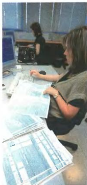
▲ ΓΙΑ ΝΑ ΡΥΘΜΙΣΤΟΥΝ σε περισσότερες από 48 δόσεις ποσά βασικής οφειλής άνω των 5.000 ευρώ απαιτείται η έγκριση της αρμόδιας υπηρεσίας