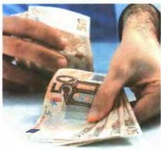
▲ ΤΟ ΕΛΑΧΙΣΤΟ ΠΟΣΟ μηνιαίας δόσης ορίζεται ως ποσοστό επί του συνολικού μηνιαίου καθαρού εισοδήματος

■ Δεν καταβάλει τυχόν εκπρόθεσμα δόση της ρύθμισης με την αναλογούσα