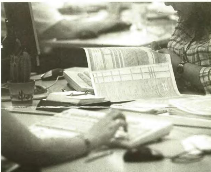
Στη φετινή φορολογική δήλωση είναι υποχρεωτικό να αναγραφούν όλα τα εισοδήματα, ακόμη και αυτά που φορολογούνται αυτοτελώς ή απαλλάσσονται από το φόρο.

Όμως, σημαντικά ποσά φόρων θα πληρώσουν φέτος και εκατοντάδες χιλιάδες φορολογούμενοι οι οποίοι απέκτησαν το 2012 εισοδήματα χαμηλότερα του αφορολόγητου ορίου των 5.000 ευρώ, καθώς θα υποβάλουν δηλώσεις και να χρεωθούν με το ελάχιστο τεκμήριο των 3.000 ευρώ και με τα πρόσθετα τεκμήρια για τις κατοικίες και τα ΙΧ αυτοκίνητα που τυχόν χρησιμοποιήσαν το 2012, με συνέπεια να εμφανιστούν ως έχοντες τεκμαρτά εισοδήματα πολύ μεγαλύτερα των 5.000 ευρώ.