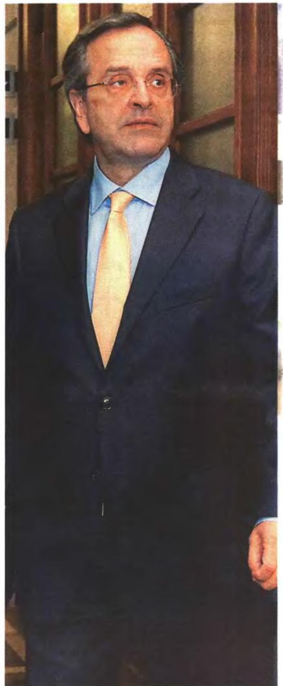
▲ Η ΠΡΟΣΩΠΙΚΗ ΕΜΠΛΟΚΗ του πρωθυπουργού κρίθηκε αναγκαία μετά και τις διαδοχικές δηλώσεις βουλευτών και των δύο κυβερνητικών κομμάτων κατά της άρσης της αναστολής των πλειστηριασμών

Ο υπουργός Εσωτερικών Ι. Μιχελάκης σε δηλώσεις του (Μega) χαρακτήρισε «έγκλημα» την προσφυγή στις κάλπες αυτήν την ώρα. «Έχει γίνει μια μεγάλη προσπάθεια τον τελευταίο χρόνο. Πρέπει να ολοκληρωθεί για να έχουμε τα πρώτα απτά στοιχεία ότι οι θυσίες του ελληνικού λαού πιάνουν τόπο. Την κρίσιμη ώρα που βλέπουμε τα πρώτα δείγματα ότι το επόμενο διάστημα αλλάζει το περιβάλλον, θεωρώ έγκλημα να πάμε σε εκλογική διαδικασία», είπε χαρακτηριστικά.