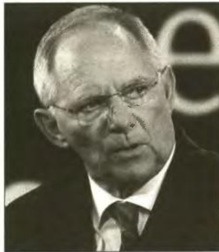
«Θα πρέπει να υπάρξει και άλλο ένα πρόγραμμα στην Ελλάδα», δήλωσε ο Σόιμπλε κατά τη διάρκεια προεκλογικής συγκέντρωσης

«Η Ελλάδα και οι δανειστές της εξετάζουν διάφορους τρόπους και παραμέτρους για