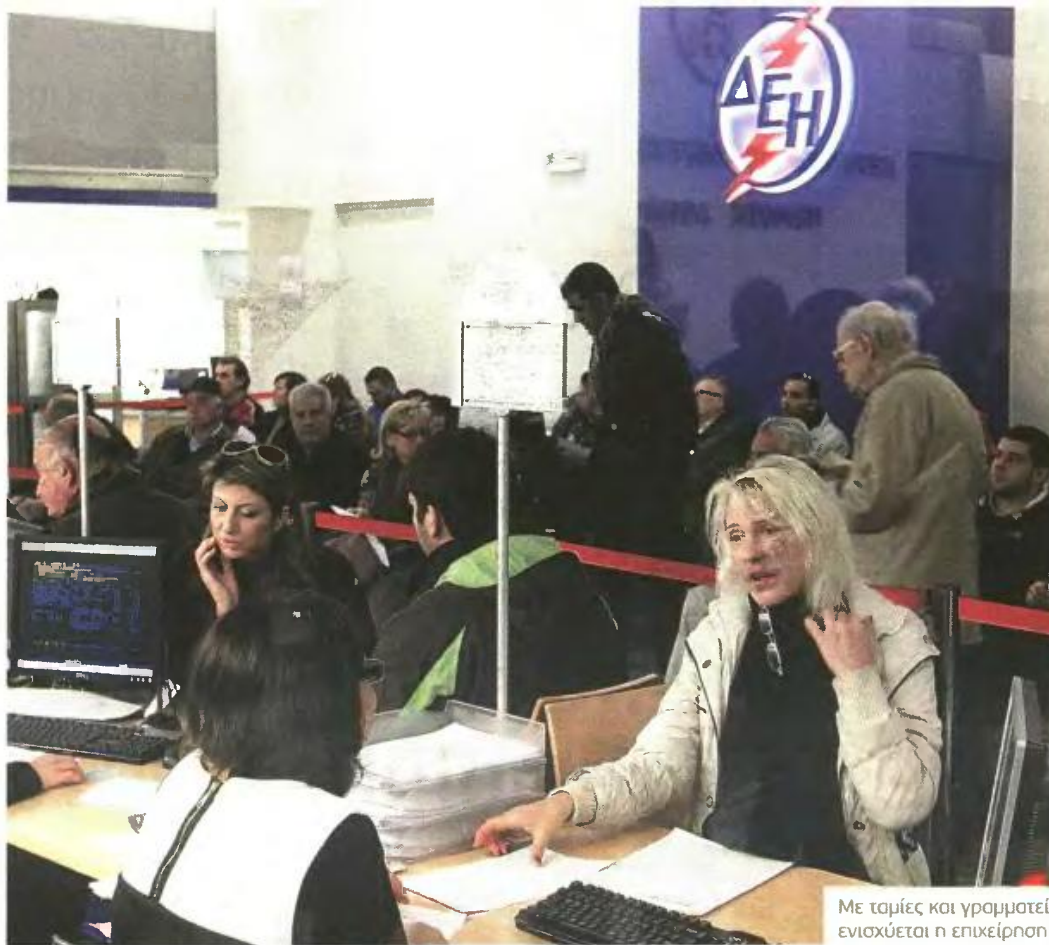
Με ταμίες και γραμματείς ενισχύεται η επιχείρηση