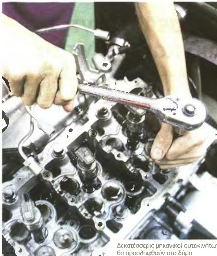
Δεκατέσσερις μηχανικοί αυτοκινήτων θα προσληφθούν στο δήμο

Δ Με 440 νέους υπαλλήλους θα ενισχυθεί ο Δήμος Θεσσαλονίκης προκειμένου να καλυφθούν ανάγκες στον τομέα καθαριότητας. Σύμφωνα με την προκήρυξη θα προσληφθούν: ΥΕ Εργατών καθαριότητας 328, ΔΕ Οδηγών απορριμματοφόρων και φορτηγών οχημάτων καθαριότητας 55, ΔΕ Οδηγών ρυμουλκικών οχημάτων καθαριότητας 18, ΔΕ Ηλεκτροτεχνιτών αυτοκινήτων 3, ΔΕ Μηχανικών αυτοκινήτων 14, ΔΕ Ηλεκτροσυγκολλητών 2, ΔΕ Τεχνιτών βαφής αυτοκινήτων 2, ΔΕ Χειριστών γερανοφόρων μηχανημάτων 2, ΔΕ Τεχνιτών ελαστικών 4, ΔΕ Εργαλειομηχανών τέρνου 2, ΔΕ Ηλεκτροτεχνιτών εναερίων 5, ΔΕ Χειριστών ανυψωτικών καλαθοφόρων μηχανημάτων 5. Το νέο προσωπικό που θα προσληφθεί, θα υπογράψει συμβάσεις εργασίας διάρκειας οκτώ μηνών. Τα απαραίτητα προσόντα για τις θέσεις των οδηγών απορριμματοφόρων είναι το δίπλωμα ΙΕΚ-ΤΕΕ ή σχολής ΟΑΕΔ ειδικότητας τεχνικού αυτοκινήτων ή συναφούς ειδικότητας, επαγγελματική άδεια οδήγησης Γ' κατηγορίας, Πιστοποιητικό Επαγγελματικής Ικανότητας και κάρτα ψηφιακού ταχογράφου για όσους απαιτείται. Για τους οδηγούς γεωργικών ρυμουλκικών χρειάζεται άδεια οδήγησης τύπου Γ' και Ε'. Για τις υπόλοιπες ειδ-