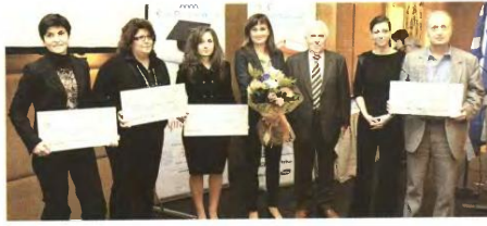
Στηγμήματα από τις δράσεις της FrieslandCampina Hellas στο πλαίσιο της Εταιρικής Κοινωνικής Ευθύνης.