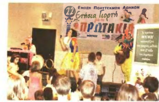
Οι εργαζόμενοι στη FrieslandCampina έχουν δημιουργήσει σχέσεις αμοιβαίας εκτίμησης και εμπιστοσύνης με την ελληνική οικογένεια.