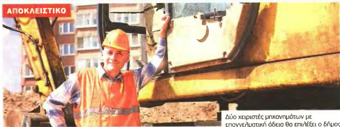
Δύο χειριστές μηχανημάτων με επαγγελματική άδεια θα επιλέξει ο δήμος