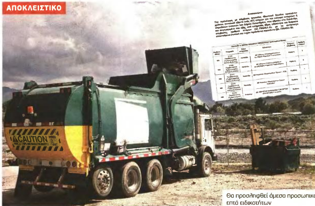
Θα προσληφθεί άμεσα προσωπικό επτά ειδικοτήτων