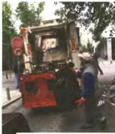
Στις 24 Ιουνίου ολοκληρώνεται η κατάθεση των αιτήσεων

Δ εως και τις 24 Ιουνίου υποβάλλονται οι αιτήσεις για τις 34 εποχικές θέσεις στο Δήμο Αγίου Νικολάου. Θα υπογραφούν συμβάσεις εργασίας διάρκειας οκτώ μηνών. Η κατανομή των θέσεων είναι η εξής: ΔΕ Χειριστών μηχανημάτων έργων (σάρωθρο) 1, ΔΕ Οδηγών απορριμματοφόρων (με κάρτα ψηφιακού ταχογράφου) 3, ΔΕ Ηλεκτρολόγων 1, ΥΕ Εργατών καθαριότητας (συνοδών απορριμματοφόρων) 14, ΥΕ Εργατών καθαριότητας 15. Θα επιλεγούν όσοι συγκεντρώσουν την υψηλότερη μοριοδότηση η οποία καθορίζεται με βάση συγκεκριμένα κοινωνικά κριτήρια. Αυτά είναι: χρόνος ανεργίας, γονέας ανήλικων τέκνων, πολυτεχνική ιδιότητα, γονέας η τέκνο μονογονεϊκής οικογένειας, βαθμός βασικού τίτλου σπουδών και εμπειρία. Αιτήσεις: Δ. Αγ. Νικολάου, Γουρνιών και Γιαμπουδάκη, Τ.Κ. 721 00 Αγ. Νικόλαος. Τηλέφωνο επικοινωνίας: 28410 83229.