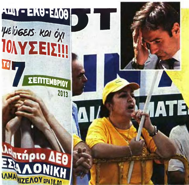
Τις μεγάλες αντιδράσεις (φωτογραφία από την κινητοποίηση στη ΔΕΘ) που προκαλεί η διαθεσιμότητα στο Δημόσιο προσπαθεί να κατευνάσει ο Κ. Μητσοτάκης (μικρή φωτ.)

έτος, δηλαδή το 2012 που αφορά εισοδήματα του 2011.