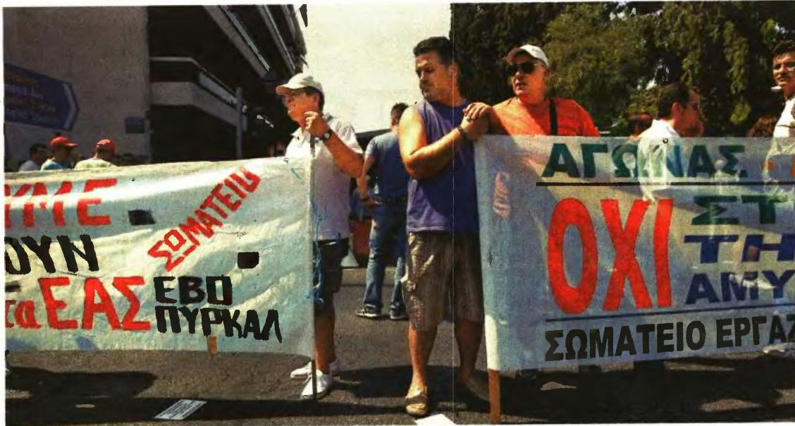
Το σχέδιο της κυβέρνησης για τις αμυντικές βιομηχανίες