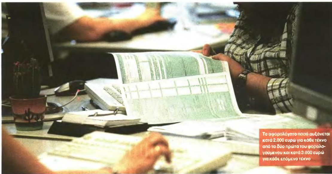
Το αφορολόγητο ποσό αυξάνεται κατά 2.000 ευρώ για κάθε τέκνο από τα δύο πρώτα του φορολογούμενου και κατά 3.000 ευρώ για κάθε επόμενο τέκνο

Όλα όσα πρέπει να γνωρίζετε για αποδείξεις, αφορολόγητο και τεκμήρια