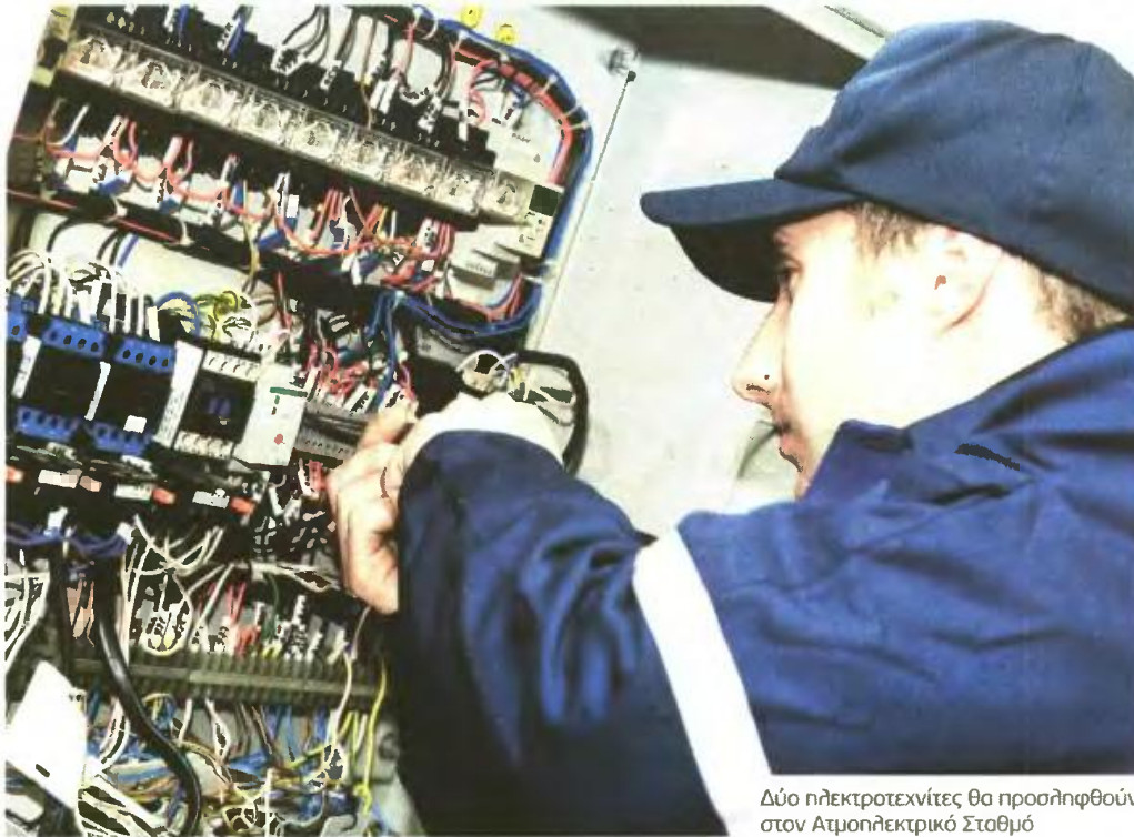
Δύο ηλεκτροτεχνίτες θα προσληφθούν στον Ατμοηλεκτρικό Σταθμό