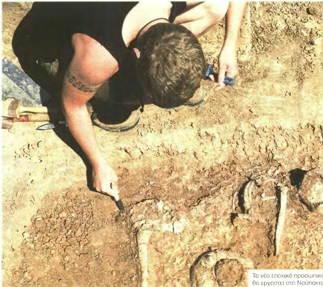
Το νέο εποχικό προσωπικό θα εργαστεί στη Ναύπακτο