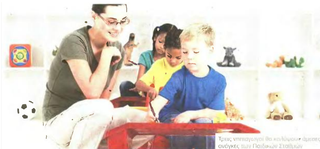
Τρεις νηπιαγωγοί θα καλύψουν άμεσες ανάγκες των Παιδικών Σταθμών