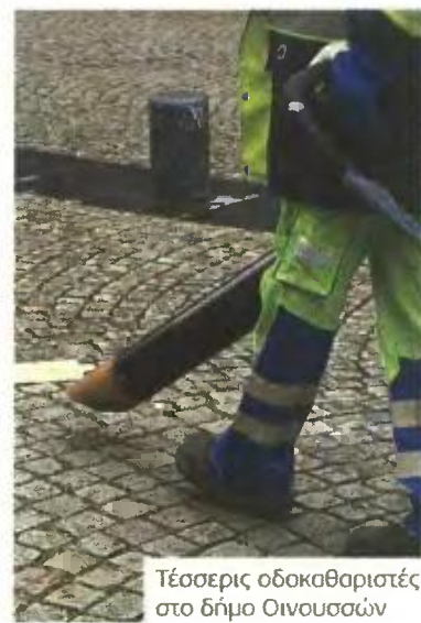
Τέσσερις οδοκαθαριστές στο δήμο Οινουσσών

Η ημερομηνία υποβολής αιτήσεων αναμένεται να ανακοινωθεί εντός των προσεχών ημερών και θα γίνεται στο Δήμο Οινουσσών, Τ.Κ. 821 01 Οινούσσες, Χίος. Για περισσότερες πληροφορίες οι ενδιαφερόμενοι μπορούν να καλούν στο τηλέφωνο 22713 51313.