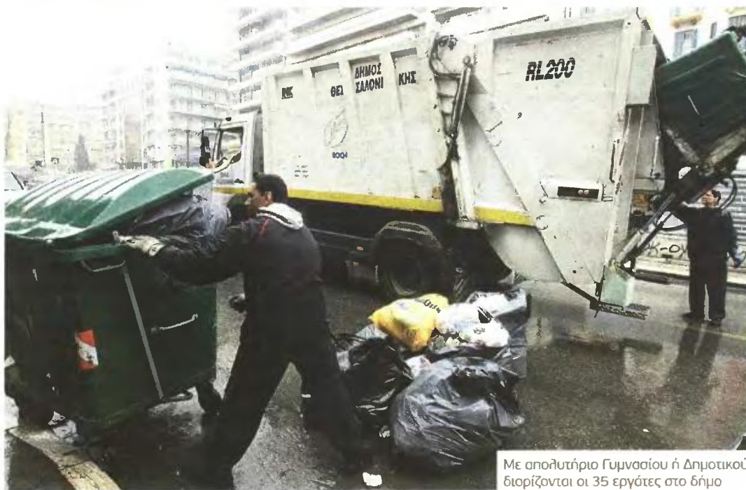
Με απολυτήριο Γυμνασίου ή Δημοτικού διορίζονται οι 35 εργάτες στο δήμο

Ζητούνται οδηγοί, ηλεκτρολόγοι, χειριστές μηχανημάτων έργου, οδοκαθαριστές και εργάτες καθαριότητας