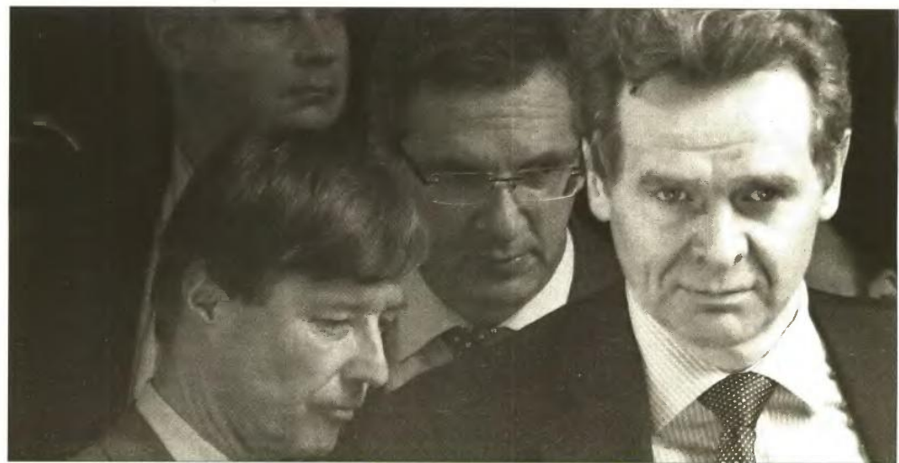
Οι εκπρόσωποι της τρόικας (Ματίας Μορς, Κλάους Μαζούχ και Πολ Τόμσεν) σε παλαιότερη επίσκεψή τους στην Ελλάδα