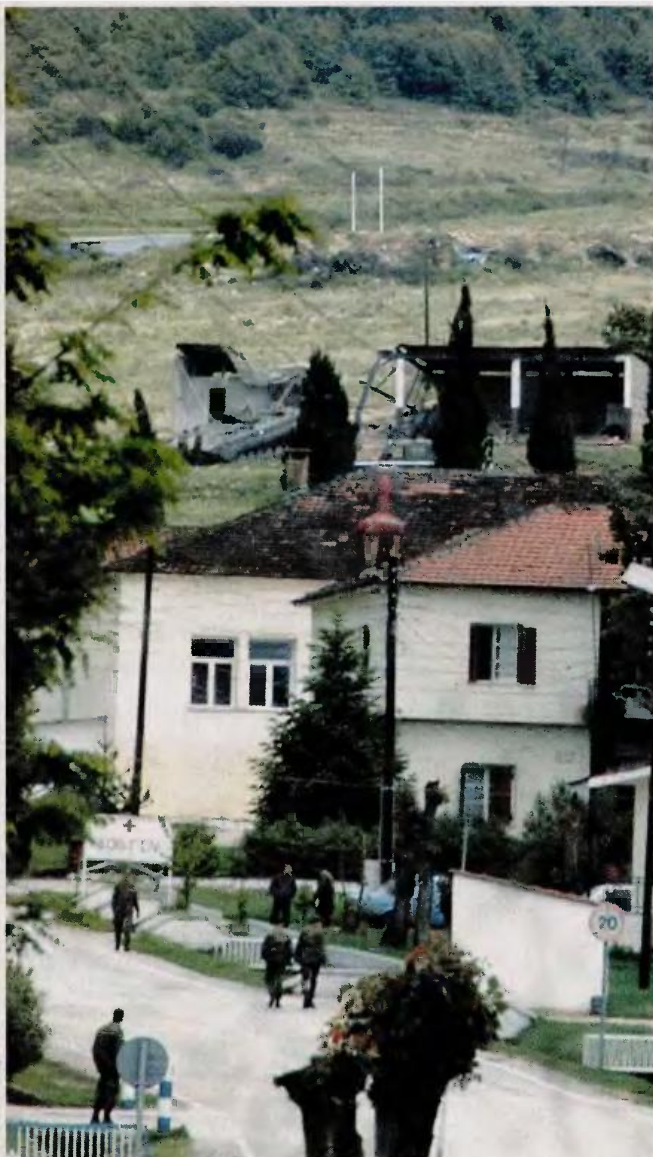
Δεν σταματούν να χτυπούν τα τηλέφωνα στα γραφεία των υπευθύνων για τις στρατιωτικές μεταθέσεις εν μέσω κρίσης.