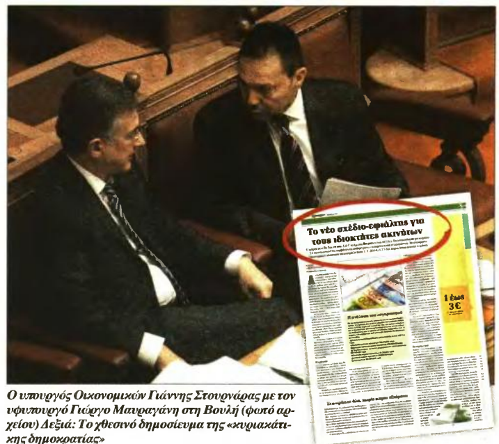
Ο υπουργός Οικονομικών Γιάννης Στουρνάρας με τον υφυπουργό Γιώργο Μανραγάνη στη Βουλή (φωτό αρχείου) Δεξιά: Το χθεσινό δημοσίευμα της «κυριακάτικης δημοκρατίας»

που κατέχουν εκτάσεις γης εκτός σχεδίου πόλεως, όπως αγροτεμάχια, αγρούς, βοσκοτόπους κ.λπ., που σήμερα απαλλάσσονται από τον φόρο, αλλά με το νέο καθεστώς θα φορολογούνται, ο ενιαίος φόρος στα ακίνητα αυτής της κατηγορίας θα κυμαίνεται από 1 έως 3 ευρώ ανά στρέμμα για τους κατ' επάγγελμα αγρότες, ενώ για τους υπολοίπους το