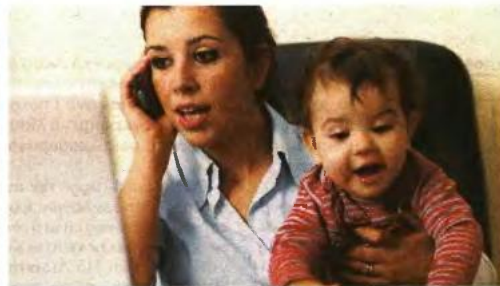
▲ ΥΠΑΛΛΗΛΟΙ με αναπηρία άνω του 67% και μονογονεϊκές οικογένειες είναι στις κατηγορίες που εξαιρούνται από την διαθεσιμότητα