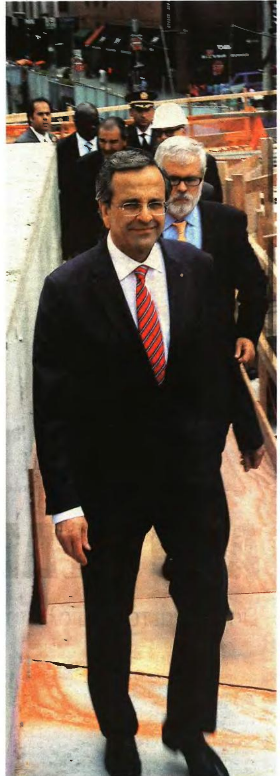
▲ Ο ΑΝΤ. ΣΑΜΑΡΑΣ απέτιε φόρο τιμής για τα θύματα της 11ης Σεπτεμβρίου στο «Σημείο Μνήμης», όπου άλλοτε υψώνονταν οι Δίδυμοι Πύργοι

Για παράδειγμα το θέμα της άρσης των πλειστηριασμών της πρώτης κατοικίας έχει τεθεί στο μικροσκόπιο των αρμόδιων υπουργείων, με την κατεύθυνση να υπάρξει λύση για τα φτωκά και μεσαία νοικοκυριά.