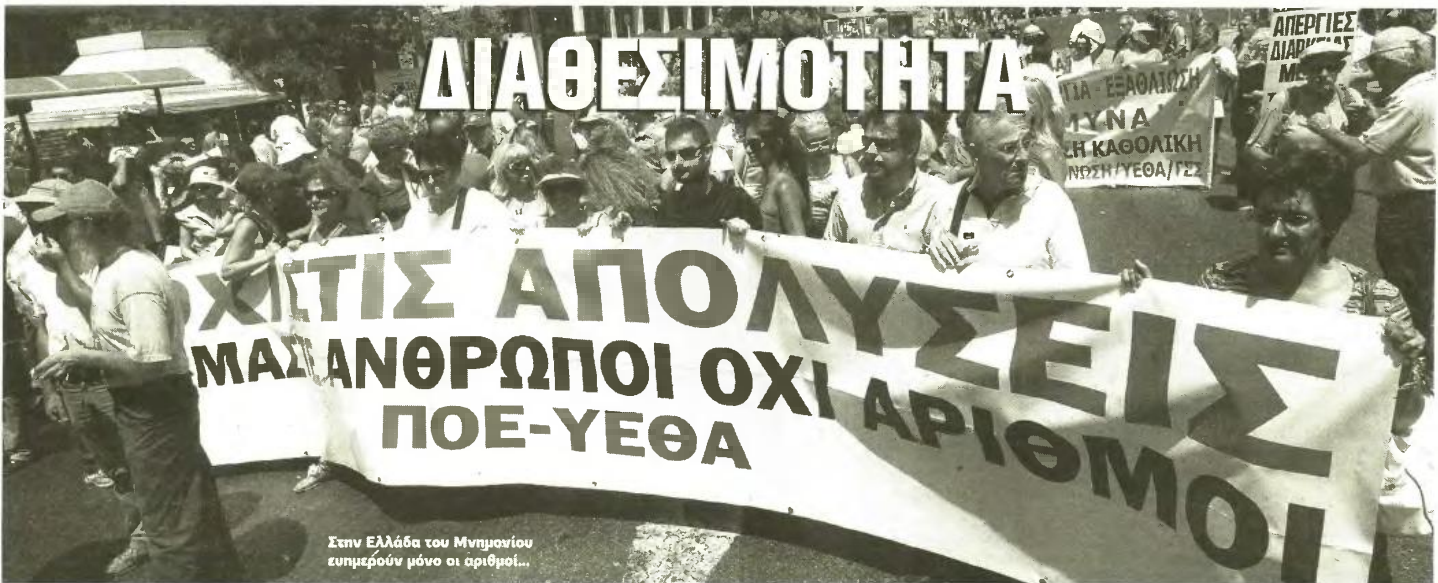
Στην Ελλάδα του Μνημονίου ζυμούνται μόνο οι αριθμοί...