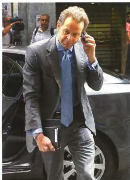
Αρνητικά μηνύματα για τον φόρο στα ακίνητα λαμβάνει από τον Πόουλ Τόμσεν ο υπουργός Οικονομικών Γιάννης Στουρνάρας

Η κυβέρνηση εκτιμά ότι με τα όρια αυτά παρέχεται προστασία ακόμη και για μεγάλα διαμερίσματα ή μεζονέτες σε ακριβές περιοχές και μελετά το ενδεχόμενο να κατεβάσει τη βάση εκκίνησης της κλιμακωτής προστασίας (ανάλογα με την οικογενειακή κατάσταση) από τις 200.000 στις 150.000