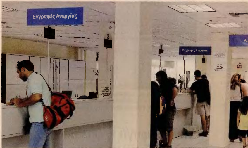
Η κυβέρνηση διαβεβαιώνει ότι θα διατηρηθεί το δίκτυ προστασίας στις ευπαθείς ομάδες (άνεργοι, πολύτεκνοι, τρίτεκνοι, χρονίως πάσχοντες) και πιθανότατα στα άτομα με πολύ χαμηλά εισοδήματα.

1. Ο χρόνος παραμονής του ακινήτου σε καθεστώς αναμονής πλειστηριασμού. Η κυβέρνηση προτιμά να προχωρήσει στη θέσπιση της πενταετούς προστα-