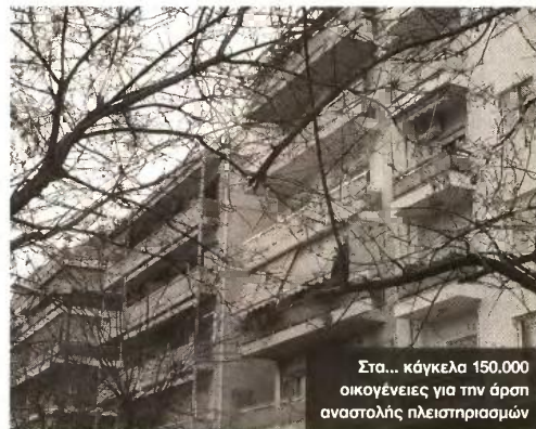
Στα... κάγκελα 150.000 οικογένειες για την άρση αναστολής πλειστηριασμών