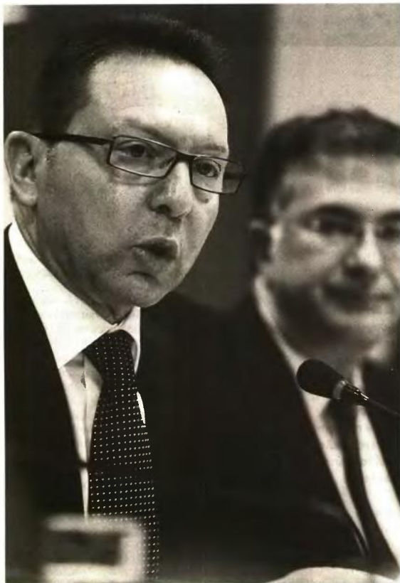
▲ Ο ΥΠΟΥΡΓΟΣ ΟΙΚΟΝΟΜΙΚΩΝ Γ. Στουρνάρας με τον υφυπουργό Γ. Μαυραγάνη παρουσίασαν χθες προφορικά τον νέο Ενιαίο Φόρο Ακινήτων

Στον αντίποδα επιβαρύνσεις θα προκύψουν για φορολογούμενους που έχουν στην κατοχή τους αγροτεμάχια, καθώς για πρώτη φορά θα κληθούν να πληρώσουν φόρο για ακίνητα τα οποία μάλιστα δεν τους αποφέρουν κανένα εισόδημα, αλλά και οι αγρότες, παρότι για αυτούς θα ισχύουν χαμηλότεροι συντελεστές για τις καλλιεργούμενες εκτάσεις.