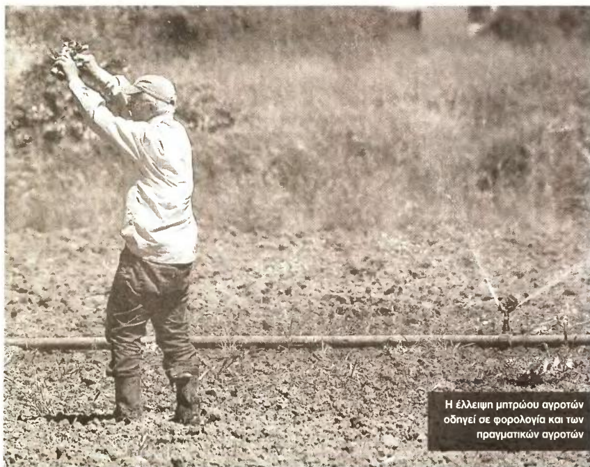
Η έλλειψη μπράβου αγροτών οδηγεί σε φορολογία και των πραγματικών αγροτών

έρχεται να συμπληρώσει τη δήμευση της ιδιοκτησίας ο νέος φόρος ακινήτων, που προβλέπει μηδενικό αφορολόγητο και επιβάρυνση ανά τ.μ. και ανά στρέμμα, χωρίς καν να εξαιρούνται οι αγρότες.