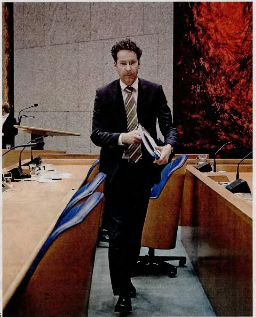
Αμέσως μετά την τηλεδιάσκεψη της Ομάδας Εργασίας του Eurogroup (EWG), ο πρόεδρος Γερόν Ντάισελμπλουμ εξέδωσε αναλυτική ανακοίνωση για την εκταμίευση της δόσης.

Χθες, πάντως, το κλίμα στο εσωτερικό της κυβέρνησης ήταν βαρύ, καθώς δεν έλειψε ο εκνευρισμός για τις καθυστερήσεις στην τυπική επικύρωση, μέσω ΦΕΚ, του πολυνομοσχεδίου και των απαιτούμενων υπουργικών αποφάσεων, αλλά και τα δηκτικά σχόλια για την αδυναμία των εμπλεκόμενων υπουργείων να διασφαλίσουν τον αριθμό των 4.200 υπαλλήλων που προέβλεπε η συμφωνία με την τρέχουσα. Παράλληλα, σε πλήρη εξέλιξη βρίσκεται το παιχνίδι απόδοσης ευθυνών για ενδεχόμενη εμπλοκή