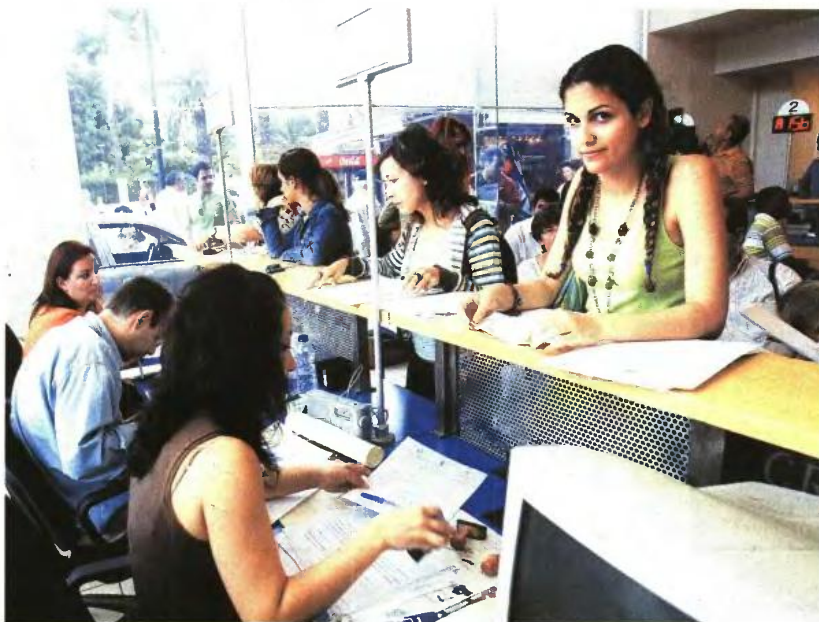
Αναισθηματογναμικό το μέτρο, λένε νομικοί, καθώς επιρρίπτονται οι συνέπειες των αργών ρυθμών Δικαιοσύνης στον πολίτη που δεν φταίει σε τίποτα

Αν και το τελευταίο διάστημα τα δικαστήρια έδιναν με το σταγονόμετρο προσωρινές διαταγές που επέτρεπαν σε συμβασιούχους να παραμένουν