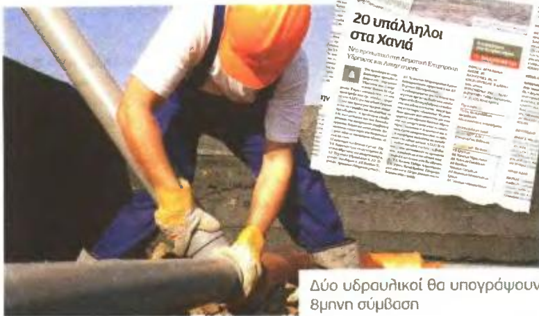
Δύο υδραυλικοί θα υπογράψουν βμην σύμβαση