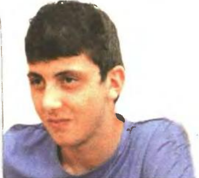
Το γράμμα που έστειλε ο 17χρονος μαθητής από την Κρήτη στον Γιάννη Στουρνάρα.