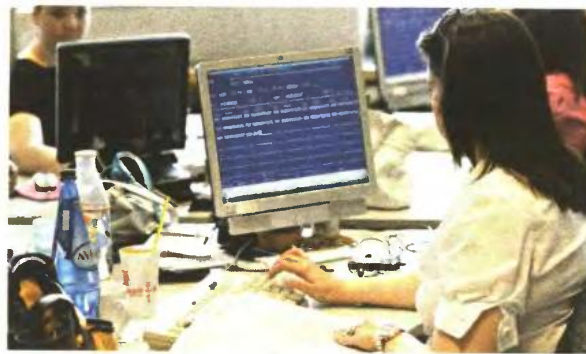
ΤΕΛΟΣ ΟΙ ΧΕΙΡΟΓΡΑΦΕΣ ΦΟΡΟΔΗΛΩΣΕΙΣ. Από φέτος όλες θα υποβάλλονται ηλεκτρονικά

Κατά πάσα πιθανότητα, πάντως, φέτος θα πληρώσουμε λιγότερο φόρο μέσω του εκκαθαριστικού για πολλούς λόγους. Πρώτον, δεν υπήρξε αναδρομική μείωση του αφορολογητού, οπότε η παρακράτηση φόρου σε μισθωτούς και συνταξιούχους έχει γίνει κανονικά. Αρα δεν υπάρχει η επιβάρυνση που υπήρξε πέρυσι. Δεύτερον, η εισφορά αλληλεγγύης έχει παρακρατηθεί ήδη από μισθούς και συντάξεις, οπότε δεν θα επιβληθεί εκ των υστέρων με το εκκαθαριστικό. Μεγαλύτερη προκαταβολή φόρου πλήρωσαν όσοι έχουν εισοδήματα από ενοίκια, οπότε ίσως προκύψει και αρνητική διαφορά, με αποτέλεσμα να τους επιστραφούν με πιστωτικό εκκαθαριστικό φόρου. Αλλάστε, σχεδόν για όλους μειώθηκαν τα εισοδήματα το 2012, ενώ η κλίμακα είναι η ίδια με εκείνη βάσει της οποίας φορολογηθήκαμε το 2011. Για να μην πληρώσουν, όμως, πρόστιμο στην Εφορία, θα πρέπει να μην ξεχάσουν να δηλώσουν αποδείξεις που να αντιστοιχούν τουλάχιστον στο 25% του εισοδήματός τους. Αν το παραλείψουν, θα πληρώσουν έστρα φόρο με συντελεστή 10% επί της αξίας των αποδείξεων που απαιτούνταν. Τις αποδείξεις θα τις φυλάνε στο σπίτι για να τις εμφανίσουν εάν τυχόν τους ζητηθεί σε μελλοντικό φορολογικό έλεγχο. Και φέτος, πάντως, θα ισχύσουν οι φορολογικές εκπτώσεις με αποδείξεις για πληρωμές από ενοίκια, γιαιρούς κ.λπ.