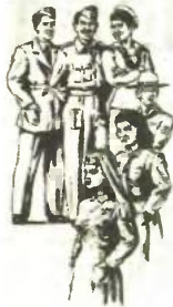
▲ Τα κορίτσια της Παιδοπόλεως Μερμυνης στέλνουν τις πρωτοχρονιάτικες ευχές τους στη Βασίλισσα Φρειδερίκη γραμμένες σε υπόδειγμα της Προνοίας Βορείων Επαρχιών της Ελλάδος (1947)