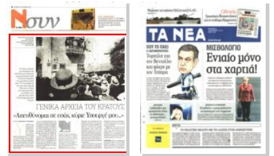
Φωτογραφία προεκλογικής συγκέντρωσης του Σπύρου Τρικούπη στην εκλογική του περιφέρεια, την Αιτωλοακαρνανία, γύρω στα 1930