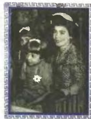
η δούλερή μας μάνα

Ο Θεός προστατεύει την Ελλάδα. Κρατάει μαζά διά ζάνα τηρίωμε τηρηγορα Μεγαλοαγαπά μας Βασίλισσα Βασίλισσα μας μάνα Τα καρτίκια τής Παιδο- πόλεως Μερμυνης έας έχουσαι χαρούμενα και ήρμυνά έόν μαυνο- ρια χρώσα, και έας έύκα- ρε ταίμε έαυ ή γαί, έμ- μαρρη έένος τής ζώας μας έσβροίωσαι εορρη Τη έσβαρ έόγμματα μαίωσα τής Τριμυώνας Μερμυνης.