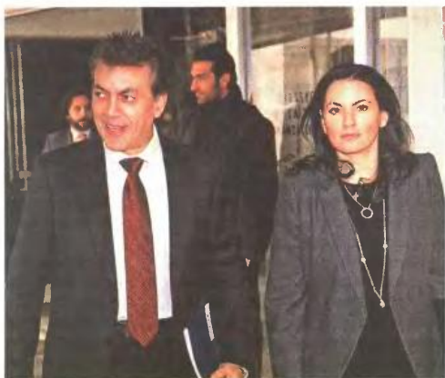
Την επίσημη ανακοίνωση θα κάνουν σήμερα οι υπουργοί Εργασίας Γ. Βρούτσης και Τουρισμού Ολγα Κεφαλογιάννη.

ΠΕΡΑΙΤΕΡΩ ώθηση στην απασχόληση στον τουριστικό κλάδο με 10.000 θέσεις εργασίας έρχεται να δώσει το νέο πρόγραμμα που ανακοινώνουν σήμερα η υπουργός Τουρισμού Ολγα Κεφαλογιάννη και ο υπουργός Εργασίας Γιάννης Βρούτσης. Το εν λόγω πρόγραμμα απευθύνεται σε νέους από 18 ως 29 ετών και θα υλοποιηθεί μέσω του Συνδέσμου Ελληνικών Τουριστικών Επιχειρήσεων (ΣΕΤΕ) και της Ελληνικής Εταιρείας Διοίκησης Επιχειρήσεων (ΕΕΔΕ). Η διάρκειά του είναι 29 μήνες (έως το τέλος του 2015) και περιλαμβάνει τρεις δράσεις: