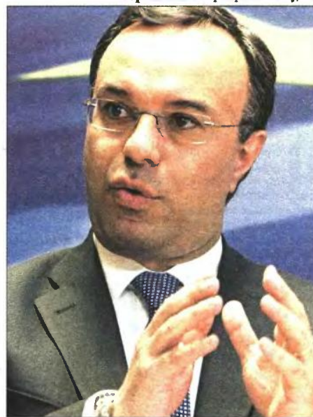
Ο αναπληρωτής υπουργός Οικονομικών Χρήστος Σταϊκούρας

Πώς το υπ. Οικονομικών, σε συμφωνία με τους δανειστής, παραπλανά τον λαό και παρουσιάζει (στον Κρατικό Προϋπολογισμό) πρωτογενές πλεόνασμα 2,861 δισ. ευρώ αντί ελλείμματος 1,414 δισ. ευρώ!