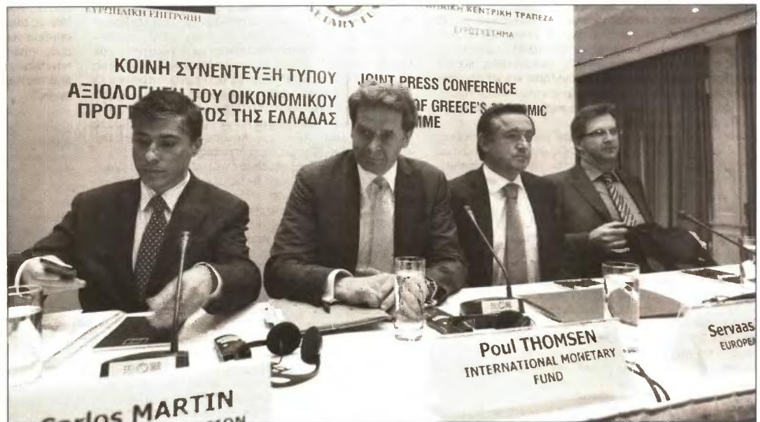
Πακέτο έκρηξη που θα περιλαμβάνει την κατάργηση, 13ου και 14ου μισθού στον ιδιωτικό τομέα, κατώτατο μισθό 495 ευρώ, απελευθέρωση των απολύσεων και άρση των πλειστηριασμών ακινήτων... μας περιμένει τον Σεπτέμβριο

Βέβαια αρκετοί από αυτούς λόγω της υψηλής φορολόγησης δεν μπορούν να πληρώσουν όχι μόνο τις δόσεις του δανείου τους, αλλά και άλλες βασικές ανάγκες τους, με αποτέλεσμα το υπουργείο να σχεδιάζει τη δημιουργία ειδικού φακέλου για κάθε δανειολήπτη που θα περιλαμβάνει στοιχεία για τον τρόπο διαβίωσης και τα εισοδήμα-