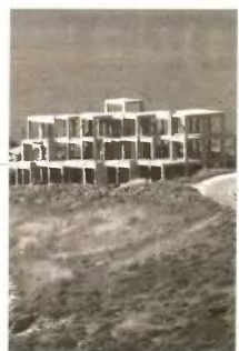
Μακροχρόνια άνεργοι έκπτωση 30% για την κύρια κατοικία.