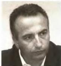
«Το σύνολο διατάξεων περιέχει έντονα πολεοδομικά χαρακτηριστικά.»

Δόσεις αποπληρωμής Οι δόσεις αποπληρωμής του προστίμου είναι είτε εξάμηνιες είτε μηνιαίες, ανάλογα με το τι θα επιλέξει ο πολίτης. Οποίτε, όποιος υπαχθεί στο νέο νόμο: ■ Το πρώτο δόκιμο από τη δημοσίευση του νόμου, το πρόστιμο καταβάλλεται εντός προθεσμίας 17 εξαμήνων (δηλαδή 102 μηνών). ■ Το δεύτερο δόκιμο από τη δημοσίευση του νόμου, το πρόστιμο θα πρέπει να καταβληθεί εντός 14 εξαμήνων (δηλαδή 84 μηνών). ■ Το τρίτο δόκιμο από τη δημοσίευση του νόμου, το πρό-