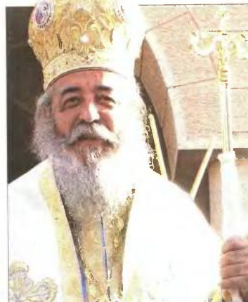
Οι αργαλειοί της νέας σχολής υφαντικής, που θα ξεκινήσει σε λίγες μέρες στη Μητρόπολη Φθιώτιδος. Πάνω: Ο σεβασμιότατος Νικόλαος