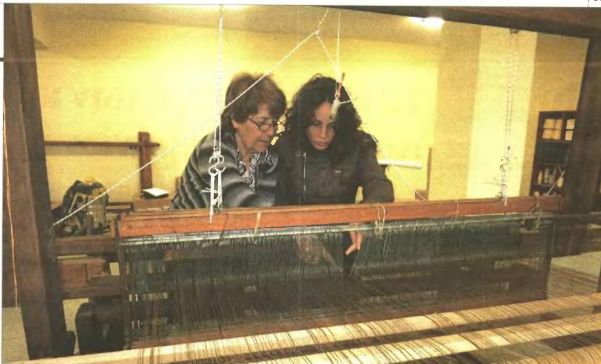
Οι δασκάλες της υφαντικής θα μεταφέρουν τις γνώσεις τους στα νέα κορίτσια

Η μόνη διαφαινόμενη έξοδος από την παρούσα οικονομική κρίση είναι η ανάπτυξη οικιακής οικονομίας με την αγροτική ενασχόληση και την καλλιέργεια των παραδοσιακών επαγγελμάτων. Στον τομέα αυτόν θα μπορούν να επιδοθούν όλα τα μέλη της οικογένειας και κατά μέγα μέρος να λύσουν το οικονομικό πρόβλημα. Αυτό που παραιτούμε τώρα να συμβαίνει στην περιφέρεια είναι ότι όλοι επιστρέφουν στον παραδοσιακό τρόπο ζωής, που ζούσαν μαζί με τους γονείς τους, στο χωριό. Για μας που βλέπουμε τα χωριά μας να ερημώνουν με την ασυμφιλία είναι παρήγορο και θετικό ότι οι άνθρωποι επιστρέφουν στο χωριό και δημιουργούν πάλι ένα νέο νοικοκυριό.