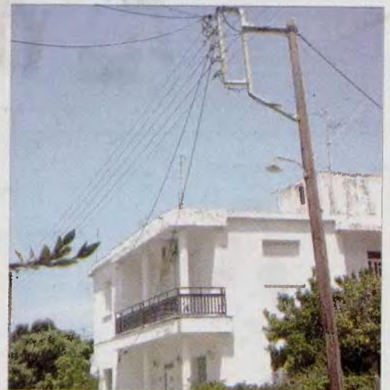
Από αυτή την κολώνα έγινε η διακοπή της ηλεκτροδότησης από το συνεργείο της ΔΕΗ

εγώ καθαρίζω κατά καιρούς κάποια σπίτια και δουλεύει μόνο η κόρη μου, αλλά αυτά τα χρήματα πηγαίνουν για το φαγητό της οικογένειας. Οι λογαριασμοί είναι απλήρωτοι και αδυνατούμε να εξοφλήσουμε το ρεύμα. Μας είπαν να δίνουμε 1000 ευρώ το μήνα και τους είπαμε να δίνουμε 100 αλλά δεν δέχτηκαν, είπαν ότι δεν είναι φιλανθρωπικό ίδρυμα. Μας είχαν πει ότι θα μας κόψουν το ρεύμα, αλλά δεν μπορώ να κάνω κάτι με ένα μεροκάματο. Ο μικρός μου γιος είναι 15 χρονών, τι θα τον ταΐσω εγώ τώρα; Να έρθουν να πάρουν το παιδί και να το ταΐσουν...» λέει με απόγνωση η 51χρονη.