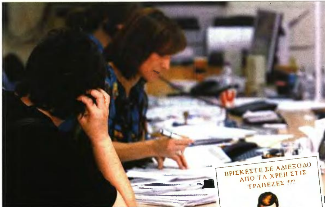
Χιλιάδες πολίτες προσπαθούν καιρό να ρυθμίσουν τις οφειλές τους. Ενθετή: Εντυπο για διακανονισμό οφειλών που μοιράζει εταιρία

Το σπίτι της «έσωσε» και μία πολύτεκνη οικογένεια στο Ρέθυμνο, αφού ο πλειστηριασμός «πάγωσε», ενώ συρρικνώθηκε και η δόση αποπληρωμής δανείου. Το ζευγάρι έχει τέσσερα ανήλικα παιδιά και είχε δανειστεί