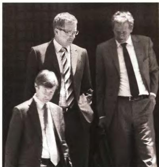
Την ίδια ώρα που οι φτωχοί αγγίζουν τα 3.000.000 και 800.000 Έλληνες δηλώνουν αδυναμία πληρωμής, η Τρόικα ζητεί αύξηση ΦΠΑ σε ρεύμα-νερό-τρόφιμα-φάρμακα

Η οικοδομική δραστηριότητα είναι στο μηδέν και 120 επαγγέλματα έχουν πεθάνει...