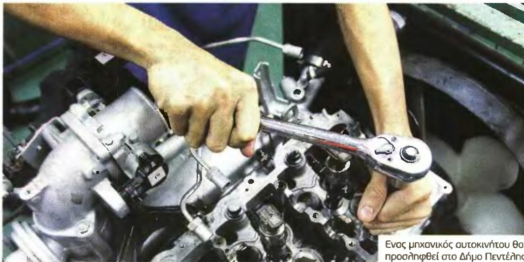
Ενας μηχανικός αυτοκινήτου θα προσληφθεί στο Δήμο Πεντέλης