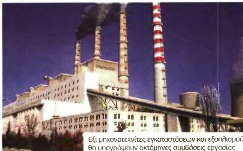
Εξι μηχανοτεχνίτες εγκαταστάσεων και εξοπλισμού θα υπογράψουν οκτάμηνες συμβάσεις εργασίας