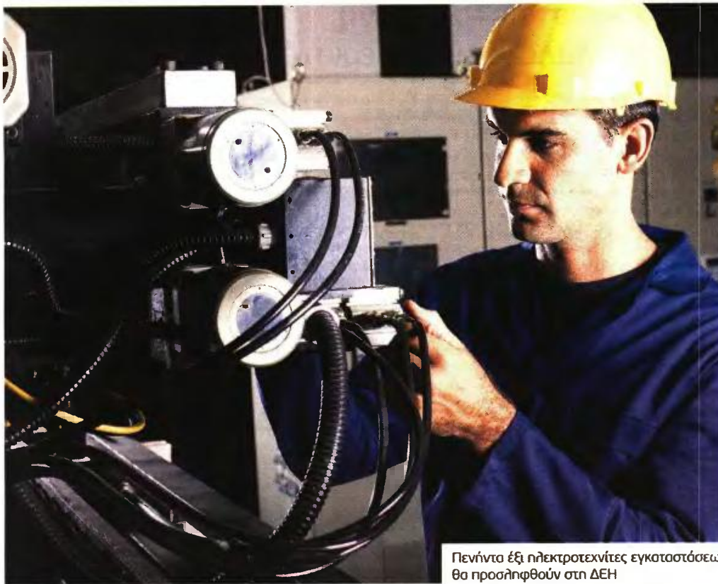
Πενήντα έξι ηλεκτροτεχνίτες εγκαταστάσεων θα προσληφθούν στη ΔΕΗ