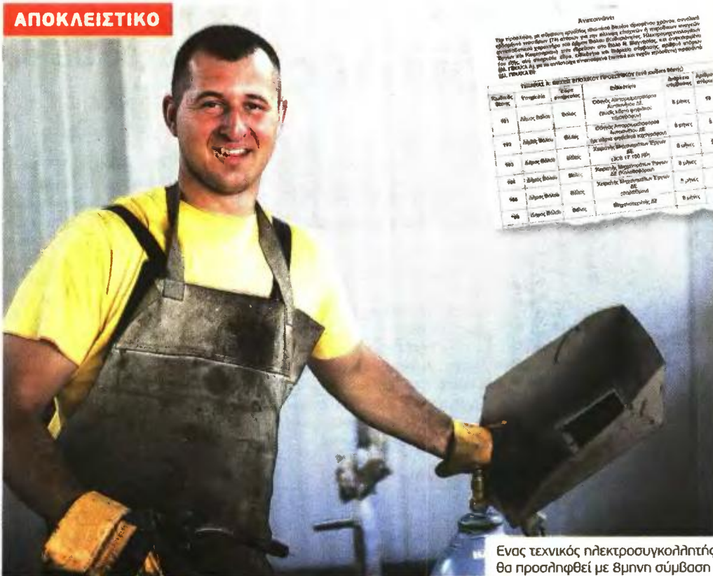
Ενας τεχνικός ηλεκτροσυγκολλητής θα προσληφθεί με 8μηνη σύμβαση