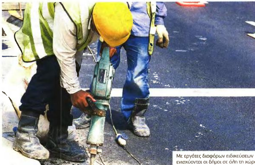
Με εργάτες διαφόρων ειδικοτήσεων ενισχύονται οι δήμοι σε όλη τη χώρα

Ζητούνται διοικητικοί, νοσηλευτές, νηπιαγωγοί, οδηγοί, χειριστές μηχανημάτων, βρεφονηπιοκόμοι, μάγειρες, εργάτες και καθαριστές