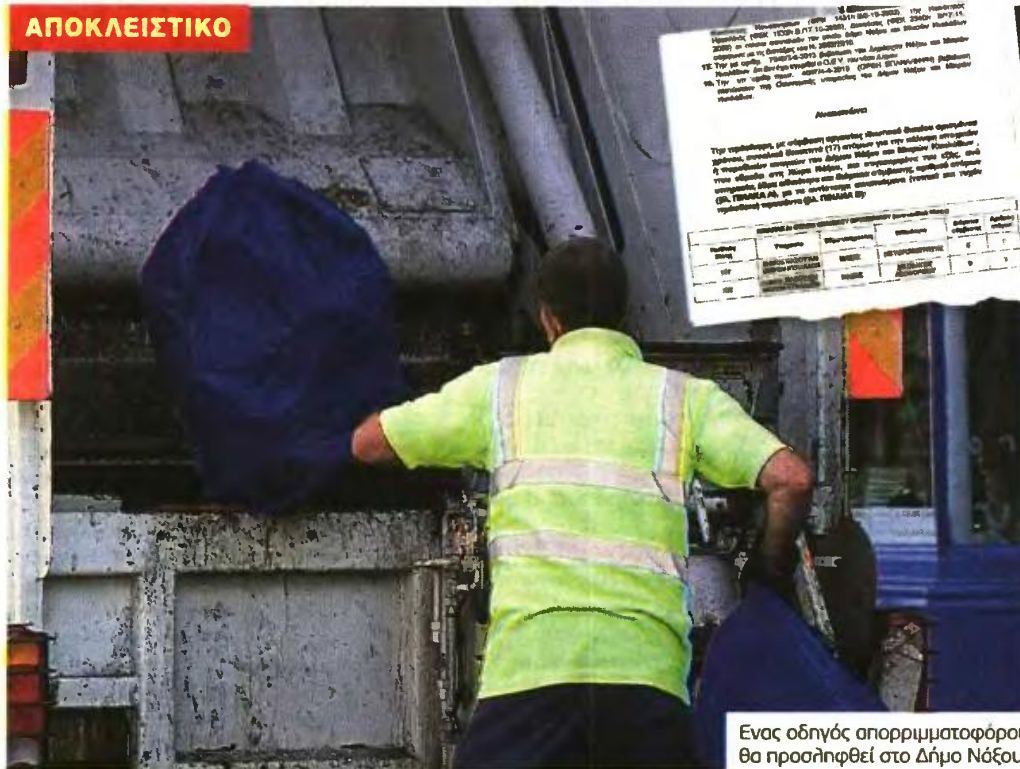
Ενας οδηγός απορριμματοφόρου θα προσληφθεί στο Δήμο Νάξου