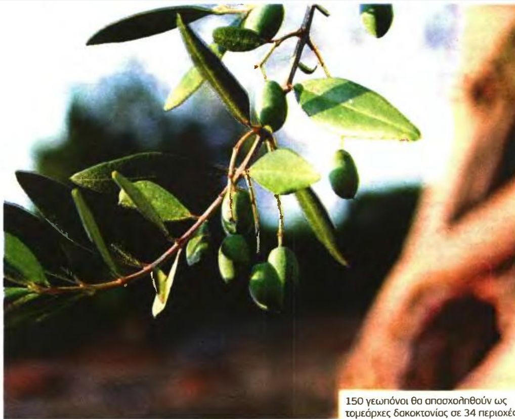
150 γεωπόνοι θα απασχοληθούν ως τομεάρχες δακοκτονίας σε 34 περιοχές