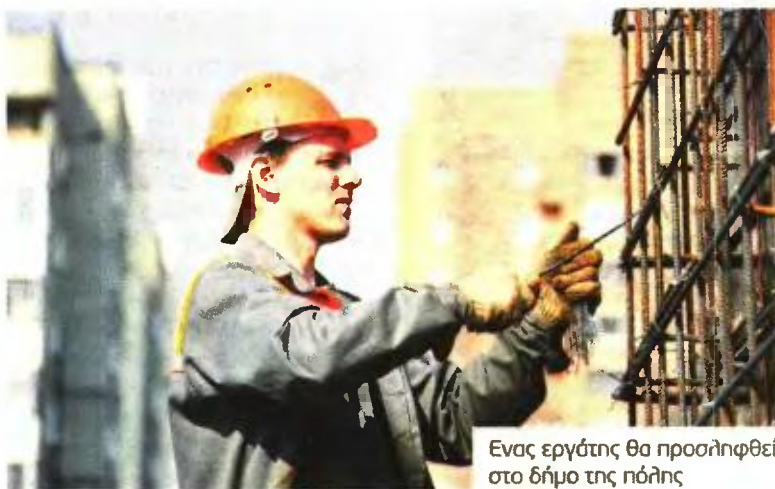
Ενας εργάτης θα προσληφθεί στο δήμο της πόλης