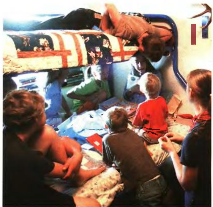
▲ ΠΟΛΥΤΕΚΝΕΣ ΟΙΚΟΓΕΝΕΙΕΣ θα μείνουν χωρίς επίδομα τέκνων μετά την ψήφιση από τη Βουλή ρύθμισης που προβλέπει ότι στα κριτήρια περιλαμβάνεται το «συνολικό οικογενειακό εισόδημα» και όχι το «οικογενειακό φορολογητέο εισόδημα» όπως ίσχυε μέχρι σήμερα

Ωστόσο, το Επιστημονικό Συμβούλιο αποδέχεται να διαφοροποιούνται οι προβλεπόμενες παροχές βάσει εισοδηματικών κριτηρίων για τους τρίτεκνους, με δεδομένο προφανώς το γεγονός πως δεν υπάρχει συνταγμα-