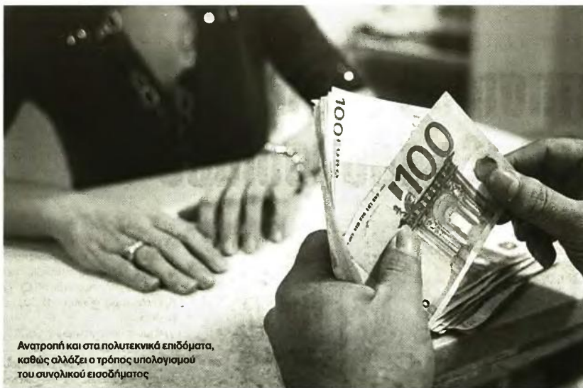
Ανατροπή και στα πολυτεκνικά επιδόματα, καθώς αλλάζει ο τρόπος υπολογισμού του συνολικού εισοδήματος

Εδώ η Επιστημονική Υπηρεσία της Βουλής, και για τη διατύπωση αυτή βάζει θέμα συνταγματικότητας θέτοντας υπόψη της κυβέρνησης τις αποφάσεις του Συμβουλίου της Επικρατείας για τους Νόμους 4093/2012, 4110/2013