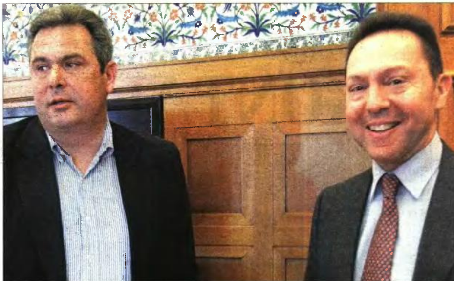
Ο Πάνος Καμμένος και ο Γιάννης Στουρνάρας σε παλιότερη φωτογραφία

Κι ενώ όλοι θα περίμεναν ότι ο κ. Στουρνάρας θα απαντούσε αμέσως, ο