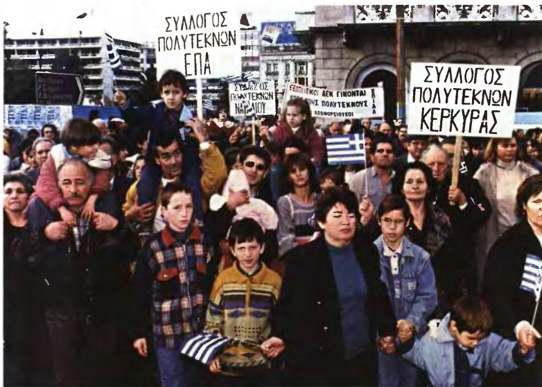
Διαδήλωση πολύτεκνων το 1996. Η φροντίδα της ποιότητας είναι διαχρονική...

Ο υπουργός δεν θέλησε να προβεί σε οποιαδήποτε δήλωση εντός της Ολομέλειας του Σώματος. Συνεργάτες του εξέφρασαν πάντως τη