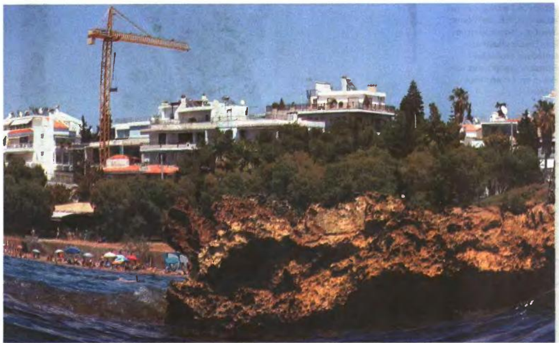
Ακίνητα που βλέπουν θάλασσα με βάση τη λογική (!) της Εφορίας αποκτούν μόνιμο... ενοίκιο προς το κράτος

Σύμφωνα με το υπουργείο Οικονομικών, ο κάτοχος ή ο επικαρ-