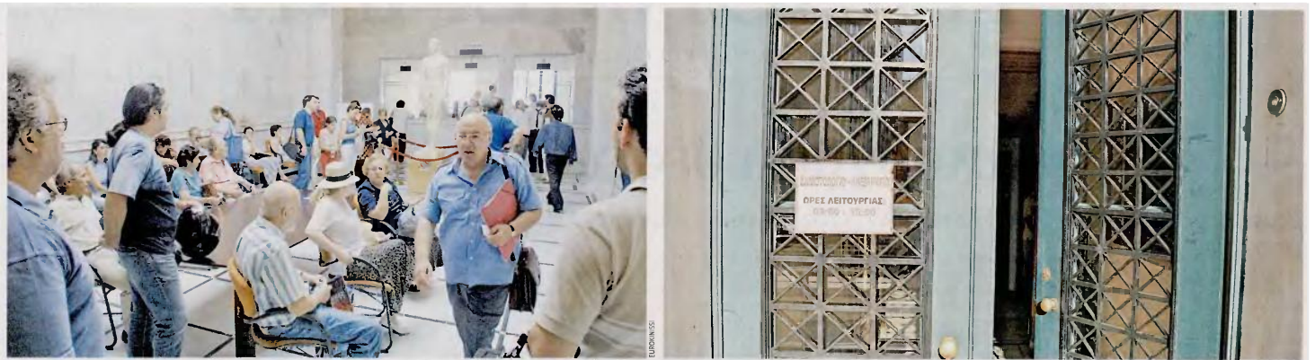
Πριν από την εφαρμογή του ηλεκτρονικού συστήματος, επικρατούσε χάος στις καταγραφές στα ληξιαρχεία, αλλά και στην αναζήτηση πληροφοριών. Νεκροί αργούσαν να δηλωθούν ή δεν δηλώνονταν ποτέ... Με την ένταξη όλων των δήμων στο Εθνικό Δημοτολόγιο, στόχος είναι να «καταργηθεί» η ληξιαρχική πράξη γέννησης, αφού όλοι οι ενδιαφερόμενοι φορείς θα έχουν άμεσα την πληροφορία που χρειάζονται μέσα από το σύστημα.