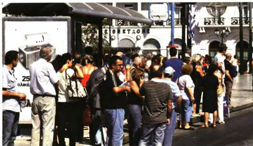
Η μόνη δοκιμασία είναι οι συχνές ακυρώσεις δρομολογίων, που ξεπερνούν το 20% των προγραμματισμένων

Πρώτη στις προτιμήσεις είναι η γραμμή εξπρές για το «Ελ. Βενιζέλος», όπου το εισιτήριο είναι 5 ευρώ