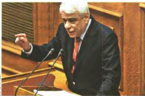
«Είναι ντροπή να προβλέψουμε πατριόσυς και πληθεύσις στο Δημόσιο» επισέμησε ο Προκόπης Παυλόπουλος

Υπενθύμισε μάλιστα την προκλητική εμφάνιση του προέδρου της ΕΛΣΤΑΤ, Α. Γεωργίου, προ ημερών στη Βουλή και τη φράση του ότι η «δίωξη εναντίον του είναι παράνομη». «Ποιος είναι αυτός ο Γεωργίου και ο κάθε κ. Γεωργίου που τα λέει αυτά;» αναρωτήθηκε ο κ. Παυλόπουλος, εκφρά-