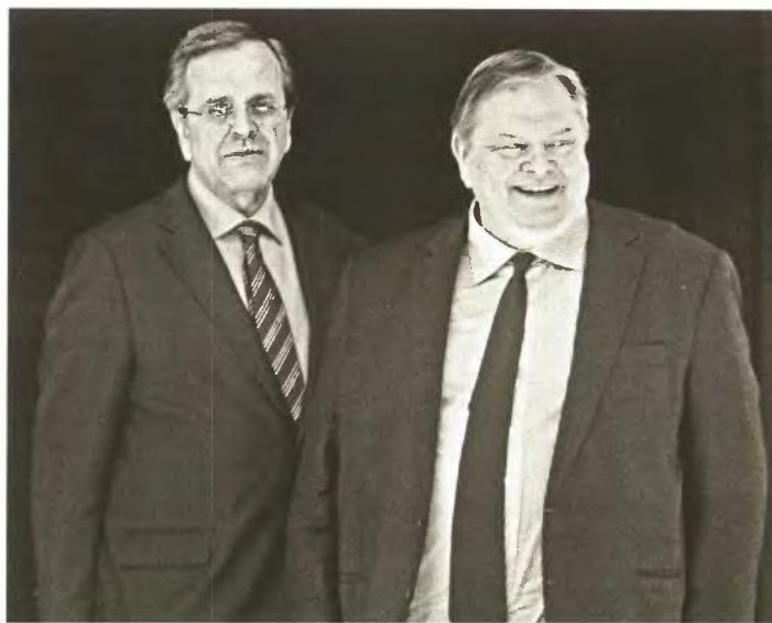
Χθες στο μεγάλο Μαξίμου συναντήθηκαν οι Αντ. Σαμαράς, Ευάγγ. Βενιζέλος, Γ. Στουρνάρας και Γ. Μιχελάκης για να καταλήξουν στις μικροτροποποιήσεις στο πολυνομοσχέδιο

Στο ίδιο πλαίσιο, η άσκηση των αρμοδιοτήτων της δημοτικής αστυνομίας, μετά την κατάργησή της, θα γίνεται με τη συνεργασία των υπηρεσιών Δημόσιας Τά-