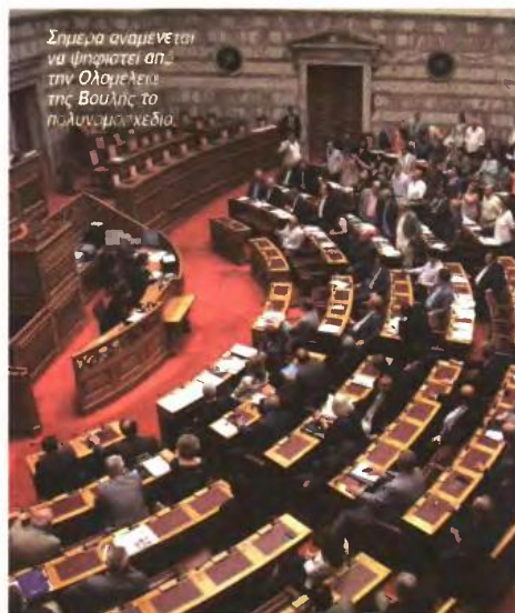
Σήμερα αναμένεται να ψηφιστεί από την Ολομέλεια της Βουλής το πολυνομοσχέδιο.

Από την άλλη πλευρά, η φορολογική διοίκηση θα πρέπει εντός 3 μηνών να απαντά σε αίτηση φορολογούμενου ο οποίος αιτείται τη μείωση του φόρου που του έχει βεβαιωθεί καθώς έχει μειωθεί το εισόδημά του άνω του 25%. Ειδικότερα, αν η φορολογική διοίκηση διαπιστώσει ότι το εισόδημα μειώθηκε πραγματικά κατά το ανωτέρω