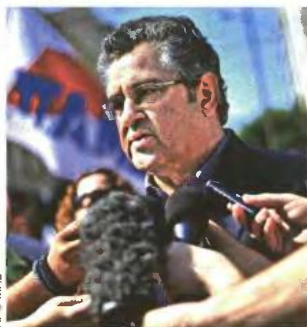
Εκρωμα χαρακτήρισε το πολυνομοσχέδιο ο γενικός γραμματέας του ΚΚΕ που συμμετείχε στην απεργιακή συγκέντρωση του ΠΑΜΕ

Εκρωμα χαρακτήρισε το πολυνομοσχέδιο ο γενικός γραμματέας του ΚΚΕ, συμμετέχοντας στην απεργιακή συγκέντρωση του ΠΑΜΕ στην Ομόνοια. «Εκτός από τις μαζικές απολύσεις, τη φοροληστεία, τις περικοπές στον ΕΟΠΥΥ, καταγγέλλουμε τη