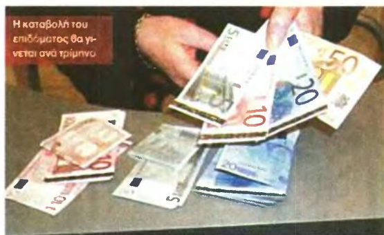
Η καταβολή του επιδόματος θα γίνεται ανά τρίμηνο

Για όσους έχουν τρία παιδιά το επίδομα είναι στα 1.400 ευρώ για εισόδημα μέχρι 11.000 ευρώ. Στα 960 ευρώ καθορίζεται το επίδομα για ει-