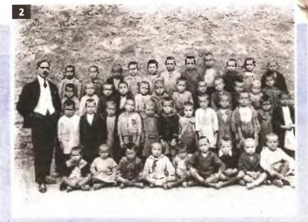
1. Επίστρατοι των Βαλκανικών Πολέμων κάνουν ασκήσεις στους Στάλους του Οθωμανίου Διός. Οι πιο πολλοί από αυτούς είναι πολύτεκνοι 2. Δημοσκό σχολείο στα αρχές του περασμένου αιώνα

Του ΤΑΣΟΥ Κ. ΚΟΝΤΟΓΙΑΝΝΙΔΗ t.kontogiannidis@realnews.gr