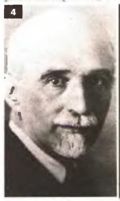
3. Ο Πάυλος Νιρβάνος -η Πέτρος Αποστολιδής- αποκαλούσε «ήρωες» τους πολυτέκνους 4. Ο Ζαχαρίας Παπαντωνίου, υποσμηναγός των πολυτέκνων 5. Η πολυτεκνη οικογένεια του βασιλιά Γεωργίου Α'

δη, ο οποίος στις 10 το πρωί της 1ης 7-1912 με 30 άλλους πολυτέκνους συγκεντρώθηκαν στην αίθουσα του δημοτικού συμβουλίου Αθηναίων ενώ συνεδρίαζε και μπροστά στον δήμαρχο και τους συμβούλους αποφάσισαν τη δημιουργία συνδέσμου. Συνέταξαν καταστατικό με τους στόχους, που ήταν η προστασία των πολυτέκνων και η καταπολέμηση της χρήσεως φαρμακευτικών μέσων προς αποτροπή της παιδοποιίας. Ο Αθηναίος γιατρός Φαραντάτος ζήτησε προνόμια για τους πολυτέκνους, όπως μείωση των φόρων και απαλλαγί από τον φόρο επιτηδεύματος.