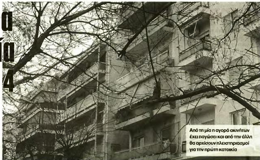
Από τη μία η αγορά ακινήτων έχει παγώσει και από την άλλη θα αρχίσουν πλειστηριασμοί για την πρώτη κατοικία

«Παράθυρο» για τη μερική άρση της απαγόρευσης πλειστηριασμών για την πρώτη κατοικία από το 2014 άνοιξε και πάλι ο υφυπουργός Ανάπτυξης Θανάσης Σκορδάς, με την κυβέρνηση να πιέζεται ασφυκτικά από την Τρόικα και να εξετάζει τη διαδικασία για να ξεπαγώσουν οι πλειστηριασμοί, βάζοντας το «κερασάκι» των προϋποθέσεων.