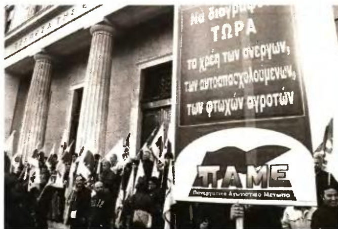
Από παλιότερη κινητοποίηση του ΠΑΜΕ ενάντια σε πλειστηριασμούς και κατασχέσεις

Η «σταδιακή» εφαρμογή του μέτρου καθώς και τα λεγόμενα «κοινωνικά κριτήρια» δεν πρέπει να ξεγελάσουν τα λαϊκά νοικοκυριά. Κατά κύριο λόγο έχουν να κάνουν με την προστασία και το συλλογικό συμφέρον των τραπεζών, αφού το