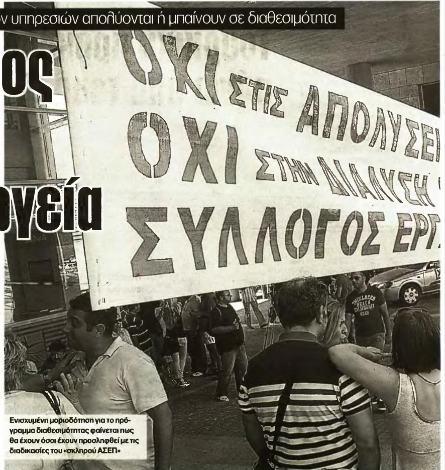
Ενισχυμένη μοριοδότηση για το πρόγραμμα διαθεσιμότητας φαίνεται πως θα έχουν όσοι έχουν προσληφθεί με τις διαδικασίες του «ακλήρου ΑΣΕΠ»

Σε περίπτωση που διαπιστωθεί ότι έχουν πλαστά δικαιολογητικά αυτά μα-