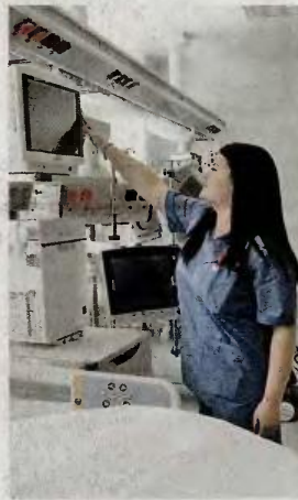
Ο αριθμός των θέσεων απασχόλησης αποκλειστικών νοσοκόμων ανά νοσηλευτικό ίδρυμα αντιστοιχεί στο 30% των οργανικών θέσεων.

Σημειώνεται ότι ήδη στις ΥΠΕ είναι στην τελική φάση η σχετική διαδικασία, με βάση την