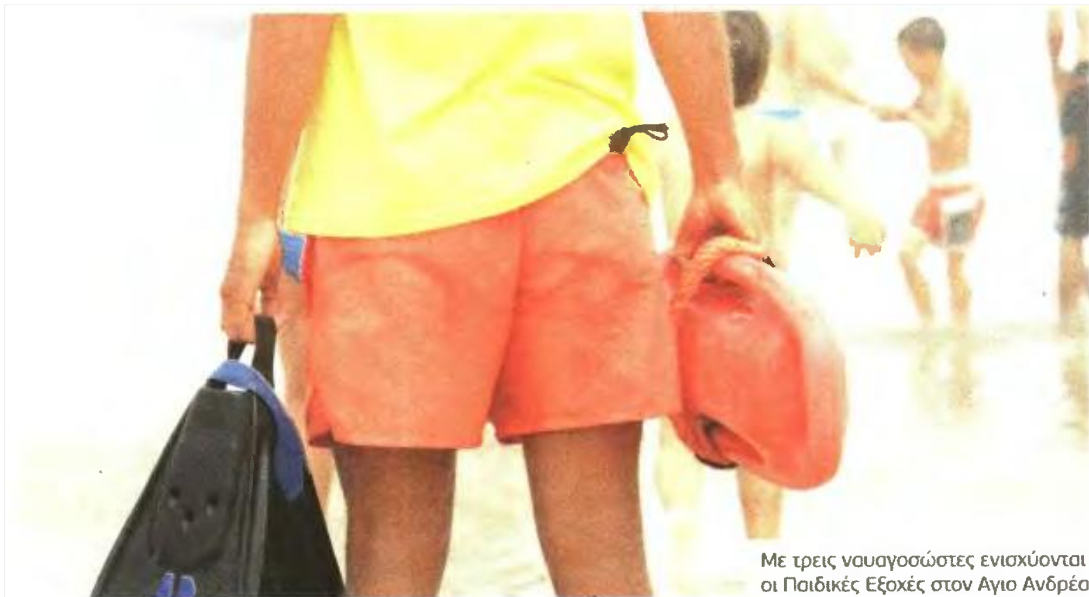
Με τρεις ναυαγοσώστες ενισχύονται οι Παιδικές Εξοχές στον Άγιο Ανδρέα

Για τους ναυαγοσώστες απαιτείται άδεια από λιμενική αρχή