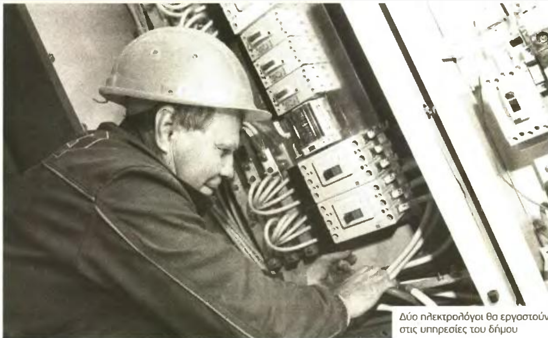
Δύο ηλεκτρολόγοι θα εργαστούν στις υπηρεσίες του δήμου