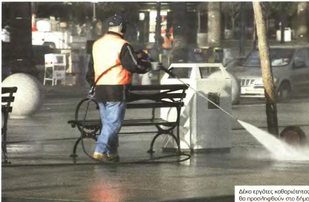
Δέκα εργάτες καθαριότητας θα προσληφθούν στο δήμο

Θέσεις για οδηγούς, χειριστές μηχανημάτων έργων και εργάτες-συνοδούς απορριμματοφόρων