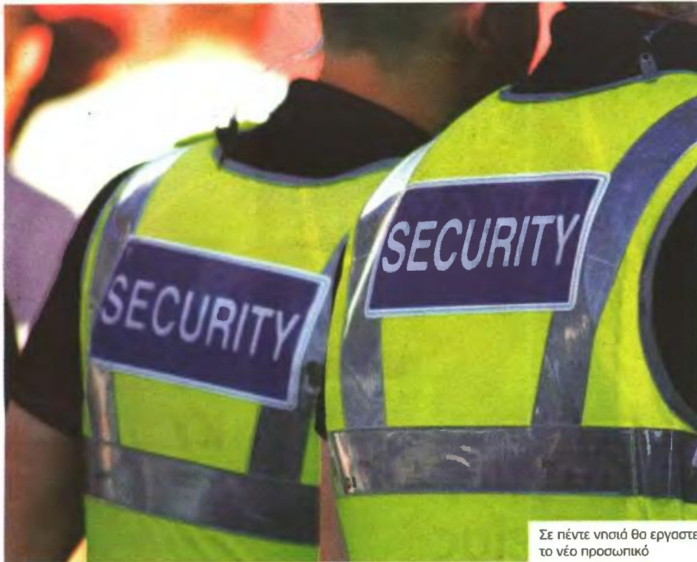
Σε πέντε νησιά θα εργαστεί το νέο προσωπικό