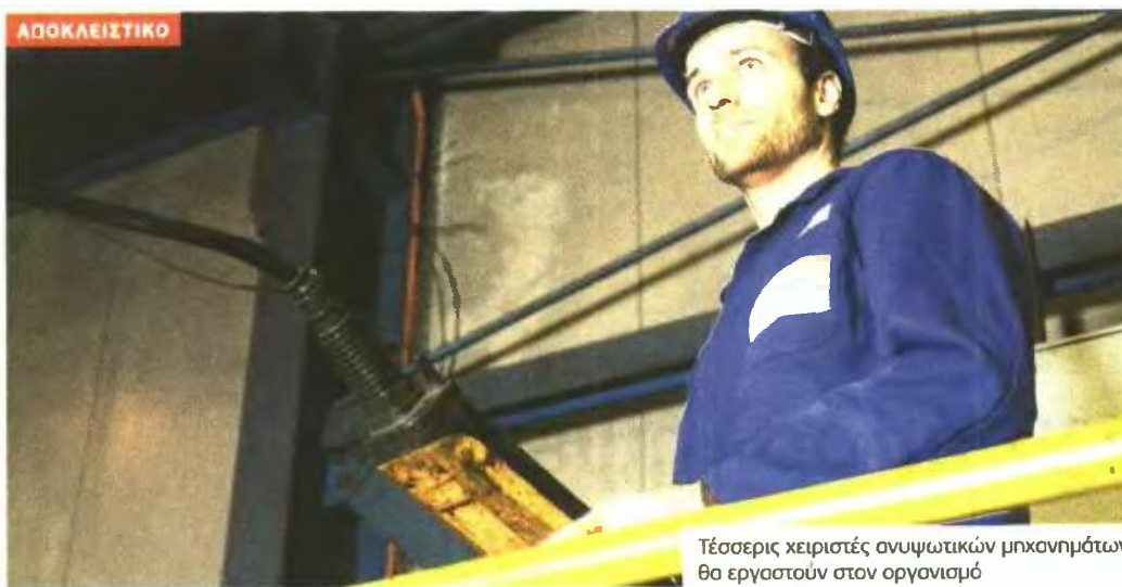
Τέσσερις χειριστές ανυψωτικών μηχανημάτων θα εργαστούν στον οργανισμό