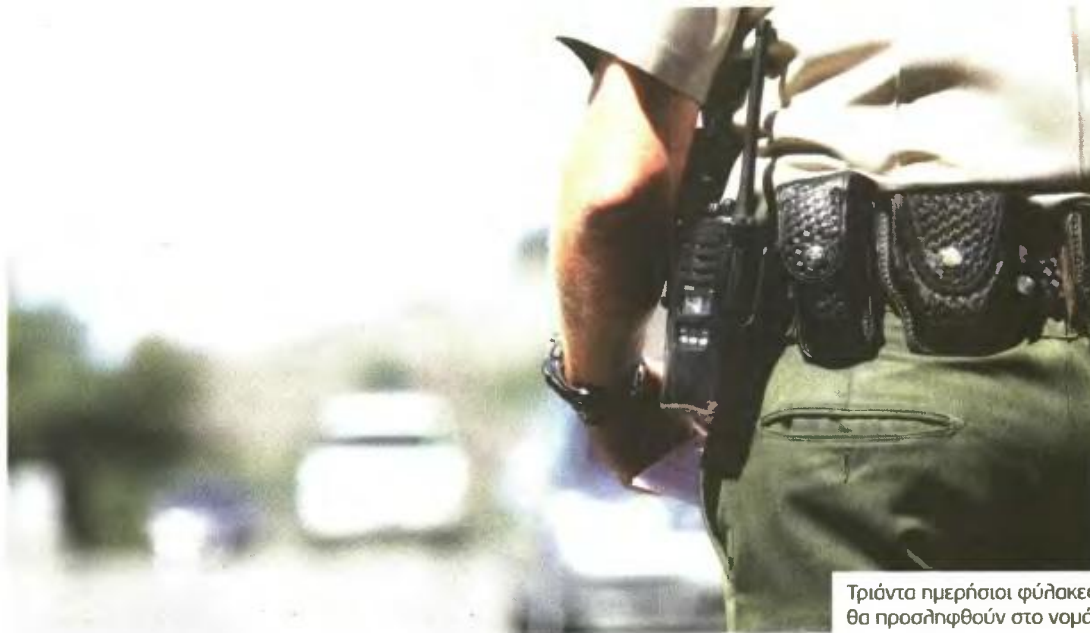
Τριάντα ημερήσιοι φύλακες θα προσληφθούν στο νομό