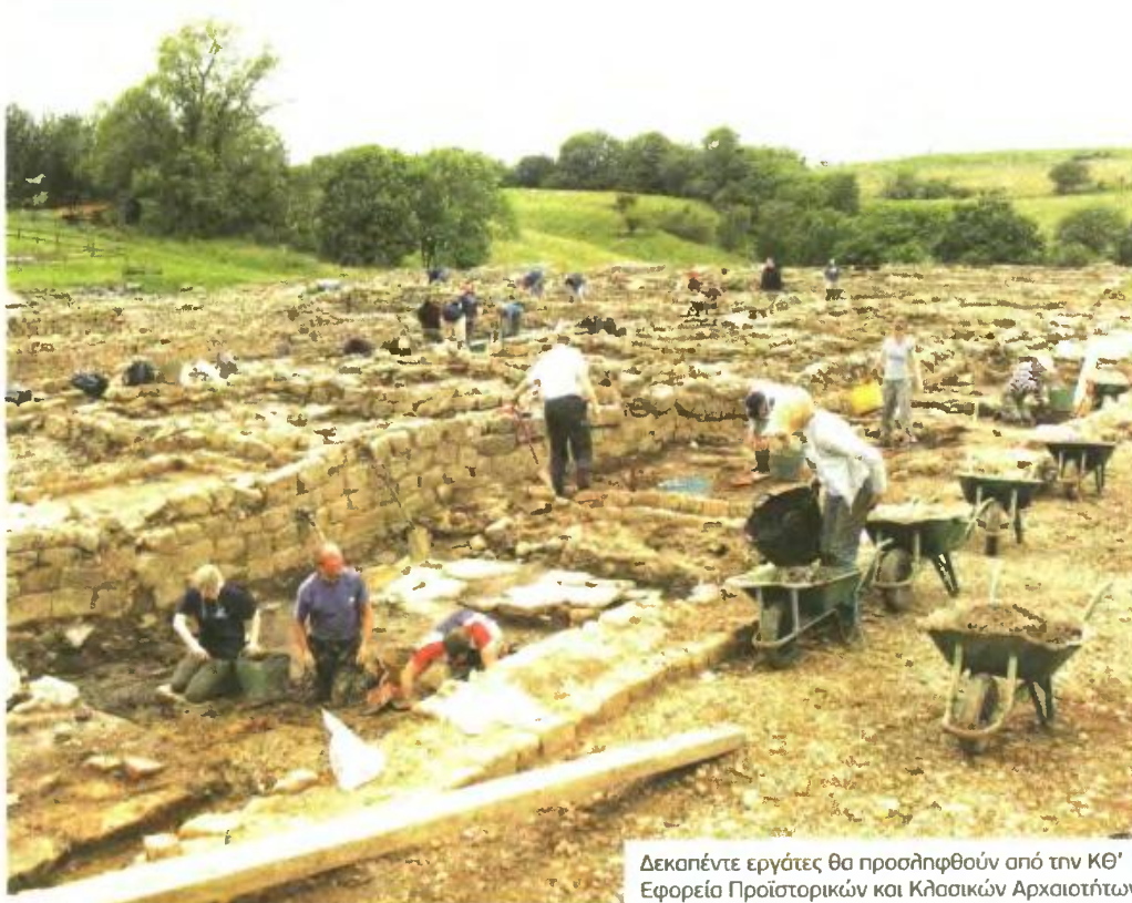
Δεκαπέντε εργάτες θα προσληφθούν από την ΚΘ' Εφορεία Προϊστορικών και Κλασικών Αρχαιοτήτων