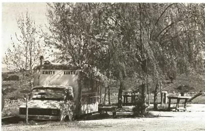
Τον κάτοχο μιας παρόμοιας καντίνας στο Χαϊδάρει εκβίαζε ο νεοδημοκράτης αντιδήμαρχος

Η αντίστροφη μέτρηση για τη σύλληψη του 45χρονου ξεκίνησε έπειτα από καταγγελία του ιδιοκτήτη της καντίνας, που βρίσκεται απέναντι από τον Διομηγείο κήπο, στις αστυνομικές αρχές ότι ο αντιδήμαρχος