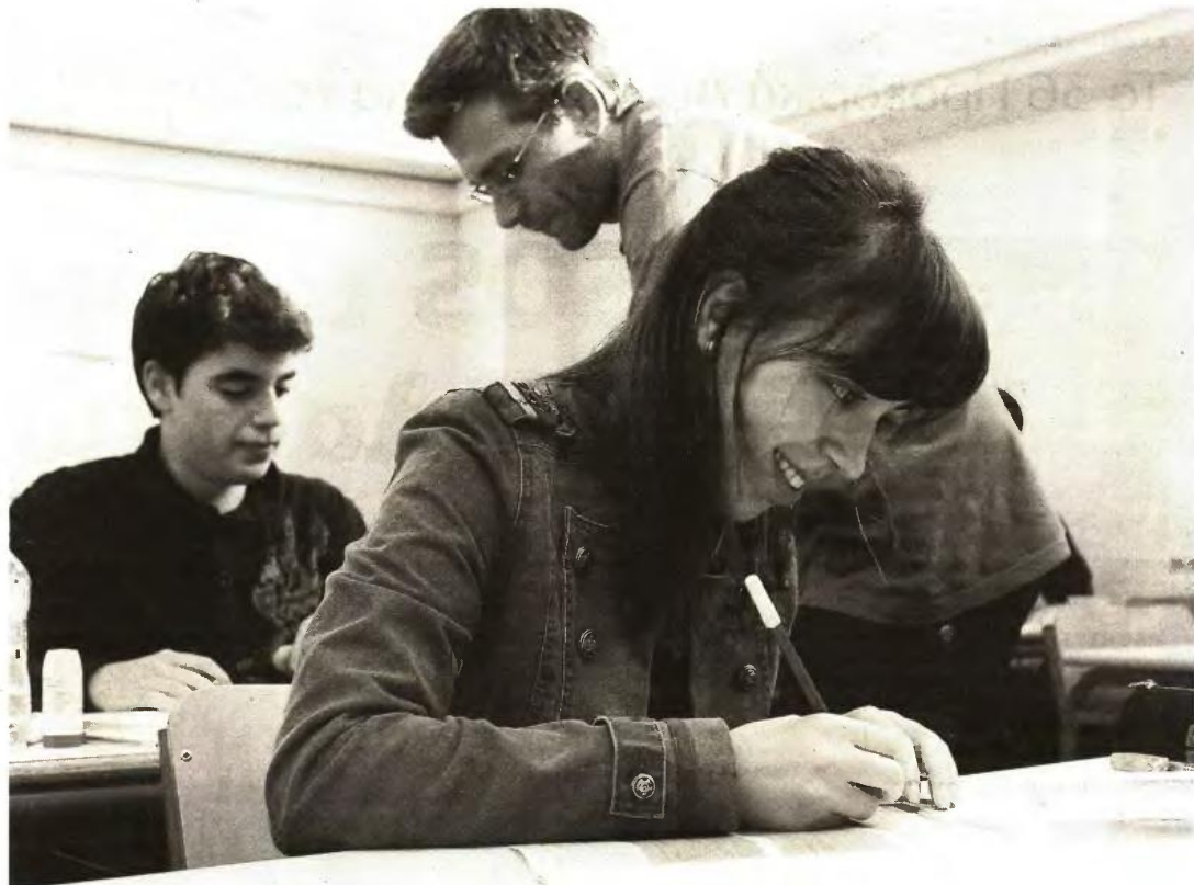
Σύμφωνα με πληροφορίες του «Εθνος», ο συνολικός αριθμός των θέσεων για όλες τις κατηγορίες θα ξεπεράσει τις 76.000

Χαρακτηριστικό είναι το παράδειγμα στο Τμήμα Ναυτιλιακών Σπουδών του Πανεπιστημίου Πειραιά. Οι περσινοί υποψήφιοι της γενικής σειράς εισήχθησαν με 16.475 μόρια, όταν οι πολύτεκνοι χρειάστηκαν 12.475 μόρια. Όσοι ανήκαν σε οικογένειες με τρία παιδιά έπρεπε να συγκεντρώσουν 15.913 μόρια, ενώ για όσους εντάχθηκαν στην κατηγορία των κοινωνικών κριτηρίων η βάση διαμορφώθηκε στα 16.290 μόρια.