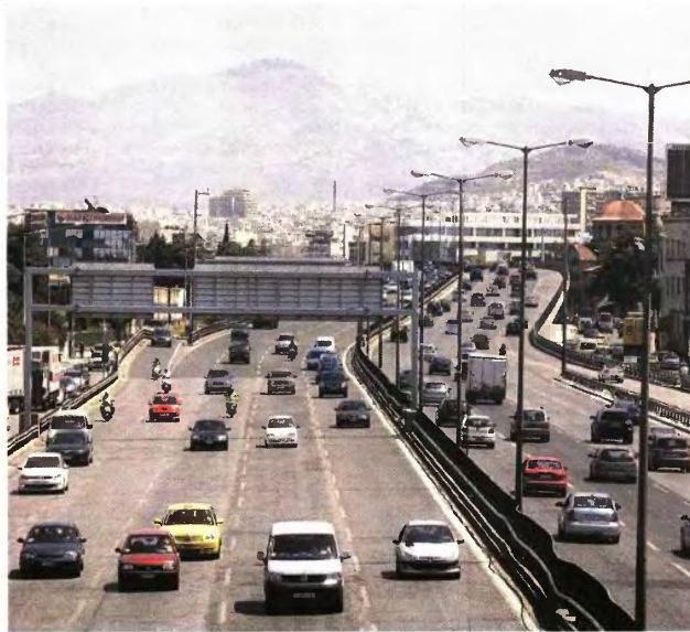
5. ΕΠΙΒΑΤΙΚΑ ΑΥΤΟΚΙΝΗΤΑ Ι.Χ.

Στους κωδικούς 291-292 γράφεται το καθαρό εισόδημα που προέρχεται από την Ελλάδα