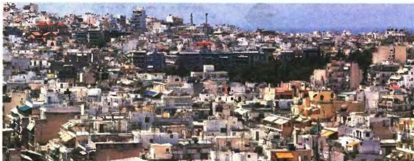
Στη ρύθμιση μπορούν να μπουν όλες οι δανειακές συμβάσεις που δεν έχουν καταγγελλεί, έστω κι αν έχουν καθυστερήσει κάποιες δόσεις.

Π ερισσότερα δάνεια θα μπορούν να υπαχθούν στη ρύθμιση που θα ψηφιστεί από τη Βουλή τη Δευτέρα, καθώς οι ευνοϊκές διατάξεις θα ισχύουν και για τα «πορτοκαλί» στεγαστικά δάνεια, δηλαδή για τα εν δυνάμει «κόκκινα».